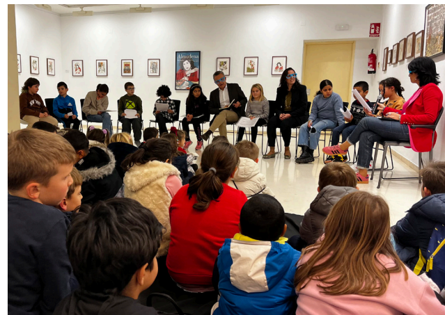
■ Niños y niñas de las ludotecas municipales aportaron propuestas imaginativas a la Corporación.

Se trata de sesiones informativas dirigidas a alumnos de 6º de Primaria que están a punto de iniciarse en el manejo del móvil y redes sociales y necesitan un refuerzo de sus competencias a la hora de enfrentarse a todo lo que ofrece el mundo digital.