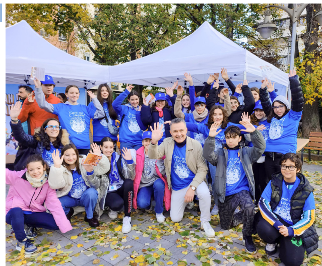
■ El parque Gallarza se llenó de actividades protagonizadas por niños y niñas.

Los eventos culminan este viernes 29 con un Encuentro de coros juveniles que se celebra en el Auditorio Municipal a partir de las 19:00 horas. La actividad está organizada por la asociación En Kanto Vocal y en la misma participará también un coro joven procedente de Tudela (Navarra).