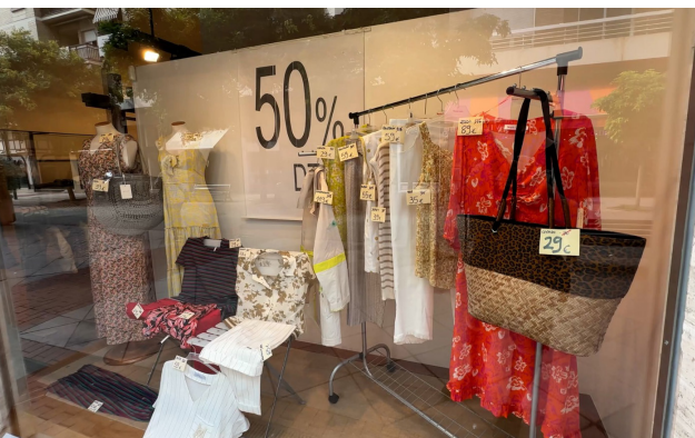
■ El comercio local contará con ayudas municipales.

El Consistorio aprobó un programa de ayudas para entidades sin ánimo de lucro vinculadas al comercio local y a la artesanía, como asociaciones de comerciantes, federaciones de empresarios de comercio minorista y asociaciones de artesanos, para la promoción y dinamización comercial minorista y artesano de la ciudad.