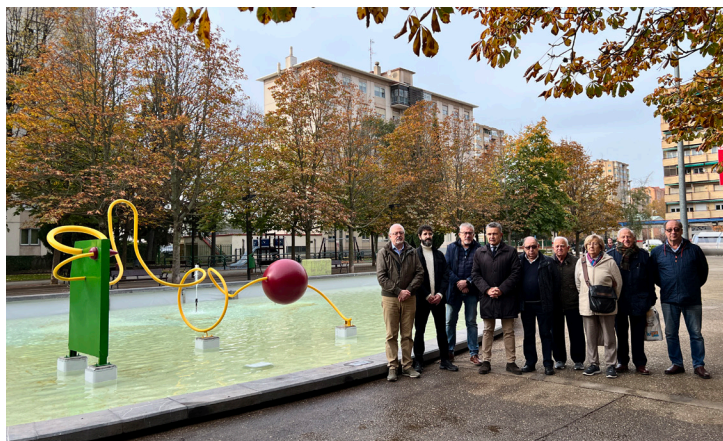
■ Vecinos, autoridades y el autor de la escultura ante la fuente.

Separada de la fuente por un murete, se ha creado una nueva zona estancial con rampa de acceso, que se completará próximamente con el equipamiento de bancos de asiento. La actuación ha incluido la reciente instalación de una serie de elementos biosaludables