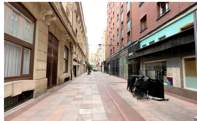
■ La reurbanización de Beti Jai será una de las inversiones.

Las obras por todos los barrios llegarán a las calles Piscinas (200.000 €), avenida de Lobete (150.000 €), plaza de Valcuerna (150.000 €), Canicalejo (135.000 €), Rosa