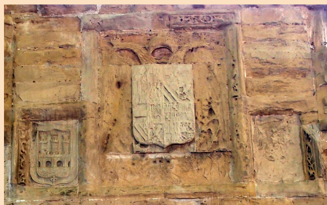
■ Escudos de la Puerta del Revellín, labrados hace 500 años.

A través de los libramientos de pago vamos viendo desfilar en 1524 una pléyade de trabajadores: canteros, obreros, peones, carpinteros, herreros, cerrajeros, fusteros, empedradores, medidores de cal, carreteros y mozas con bestias y asnos que traen piedra, arena, ripio, cascajo, cal; se colocan argollas, tejuelos, cerrajas, aldabas, arpones, cadenas, cuezos y bayartes; se usan azadas, puntas de escodas, palas de hierro,