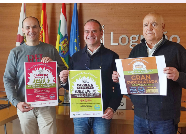
■ Presentación de la carrera.

La prueba, de 6 kilómetros, se celebrará el próximo 15 de diciembre y la salida y la meta estarán ubicadas en la Plaza del Mercado. La carrera se incluye en el IX Circuito de Carreras de Logroño Deporte y, por segunda vez, tiene un recorrido urbano.