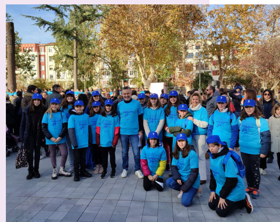
■ La celebración del Día de la Infancia en 2023 acogió a abundante público familiar.

El programa incluye también un punto de información del Consejo de Infancia y Adolescencia de Logroño, en el que sus propios miembros darán a conocer las acciones que realizan y donde se recogerán ideas de mejora para la ciudad.