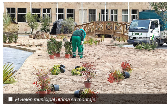
El Belén municipal ultima su montaje.

Además, habrá varios elementos singulares: un árbol de navidad con estrella de 14 metros (plaza del Mercado), un gran osito photocall (Cien Tiendas), una caja de regalo (parque de La Cometa), dos globos (Avenida de Portugal