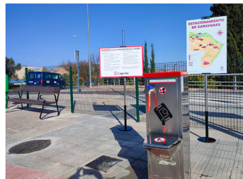
■ Nuevo aparcamiento de caravanas en Río Lomo.

La obra, realizada por la empresa Antis, se ha completado con la ejecución de una red de saneamiento para recogida de vertidos y de una toma de agua potable. Con ambas actuaciones, se aportan los servicios que habitualmente se precisan en estas áreas en las