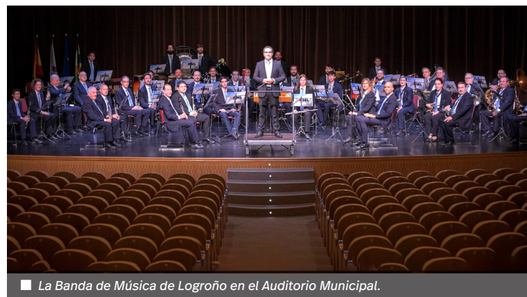
■ La Banda de Música de Logroño en el Auditorio Municipal.

La aventura a pie se realizará con una propuesta música que nos invita a subir al monte Everest, la montaña más alta de la superficie de la Tierra.