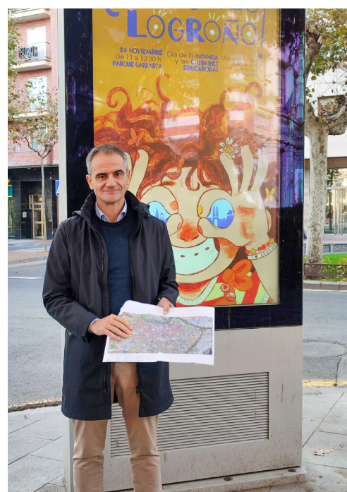
Pantalla digital en el paseo de Dax.

Otros espacios que permanecerán iluminados durante las próximas semanas son las fachadas del Ayuntamiento y del Teatro Bretón.