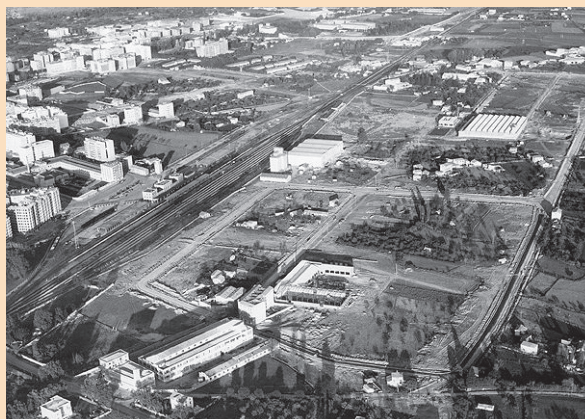
Lobete y Cascajos en 1967. Paisajes españoles.

Paralelamente, y en virtud de la Ley del Suelo de 1956, se había tramitado el Plan General de Alineaciones de Logroño, aprobado también en 1958, que dibujaba el desarrollo de la ciudad de Logroño y que, dadas las circunstancias, estaba significativamente condicionado por el nuevo trazado del ferrocarril, trazado que es asumido por el Plan como un límite relativo al crecimiento y, a la par y en otros casos (como el que nos ocupa), como frontera entre el uso residencial interior y las áreas industriales exteriores. Así, la Gerencia Nacional de Urbanización (dependiente del Ministerio de Vivienda) promovió en 1963 en nuestra ciudad dos polígonos, cuyo planteamiento tenía mucho que ver con la atracción y oportunidad que supo-