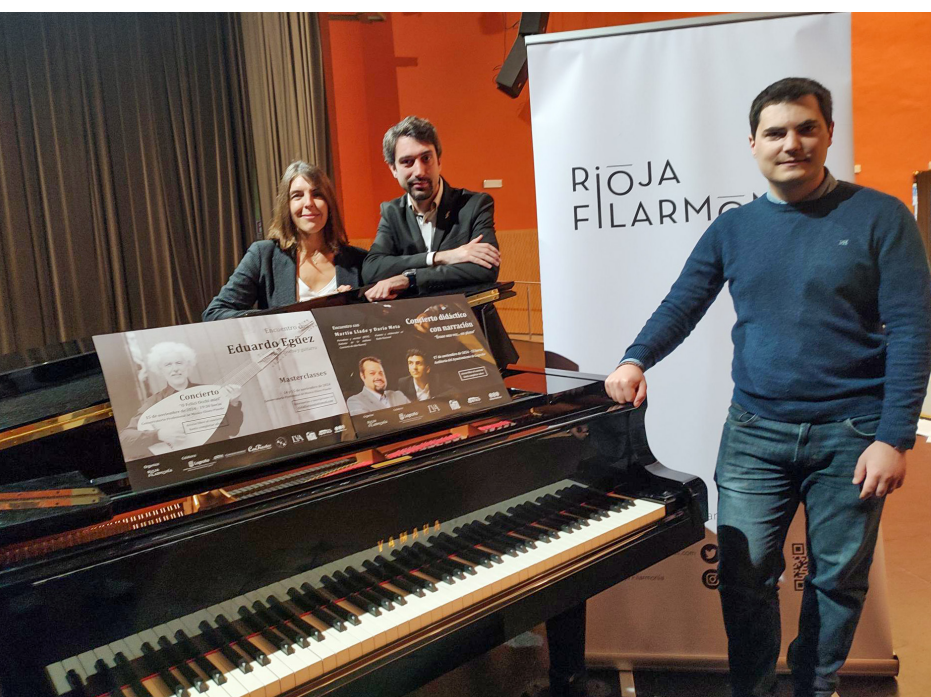
■ Presentación del programa en el Auditorio Municipal.

Rioja Filarmonía trabaja para dar a conocer la música clásica. Además, trabaja con músicos y músicas jóvenes.