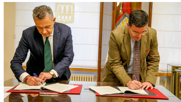
■ Firma del convenio de colaboración.

De este modo, se pretende generar ecosistemas de agrupación de empresas, especialmente compañías emergentes ( startups ) y pymes de conocimiento, que desarrollen soluciones innovadoras basadas en Inteligencia Artificial. Éstas desarrollarán proyectos piloto demostradores, validados por la Comunidad