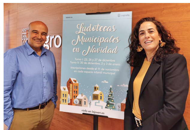
■ Presentación del programa.

■ La inscripción se puede descargar desde lojoven.es y enviarse por mail a la ludoteca correspondiente