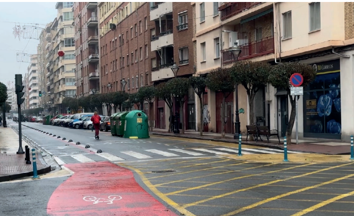
■ Calle Duquesa de la Victoria.

Tres de las inversiones destacadas para 2024 avanzan en su tramitación administrativa. En el caso de Duquesa de la Victoria y el polígono Las Cañas, con propuestas de adjudicación.