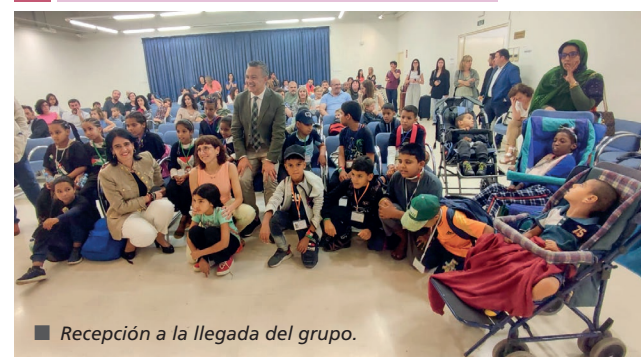
Recepción a la llegada del grupo.