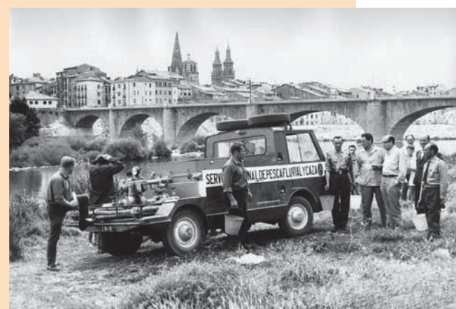
Repoblación piscícola en el Ebro en 1967

Desconocemos el desenlace final del rife narrado, pero sabemos que Lope de Vergara acabó condenado a muerte por