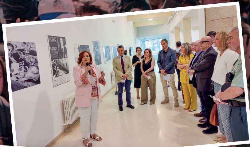
■ Miembros de la corporación municipal en la apertura de la muestra y alguna de sus imágenes.