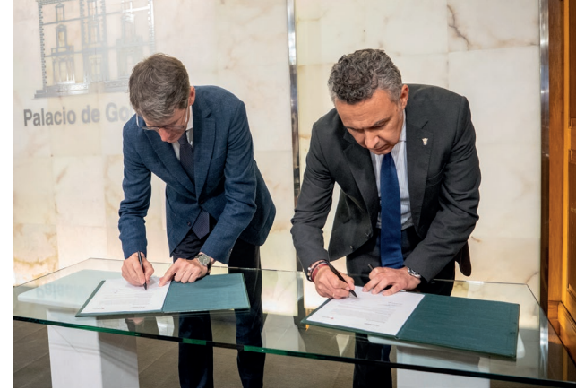
■ Acto institucional de la firma del convenio.

hace mejores a todos, teniendo en cuenta que Logroño ejerce de capital de toda La Rioja”.