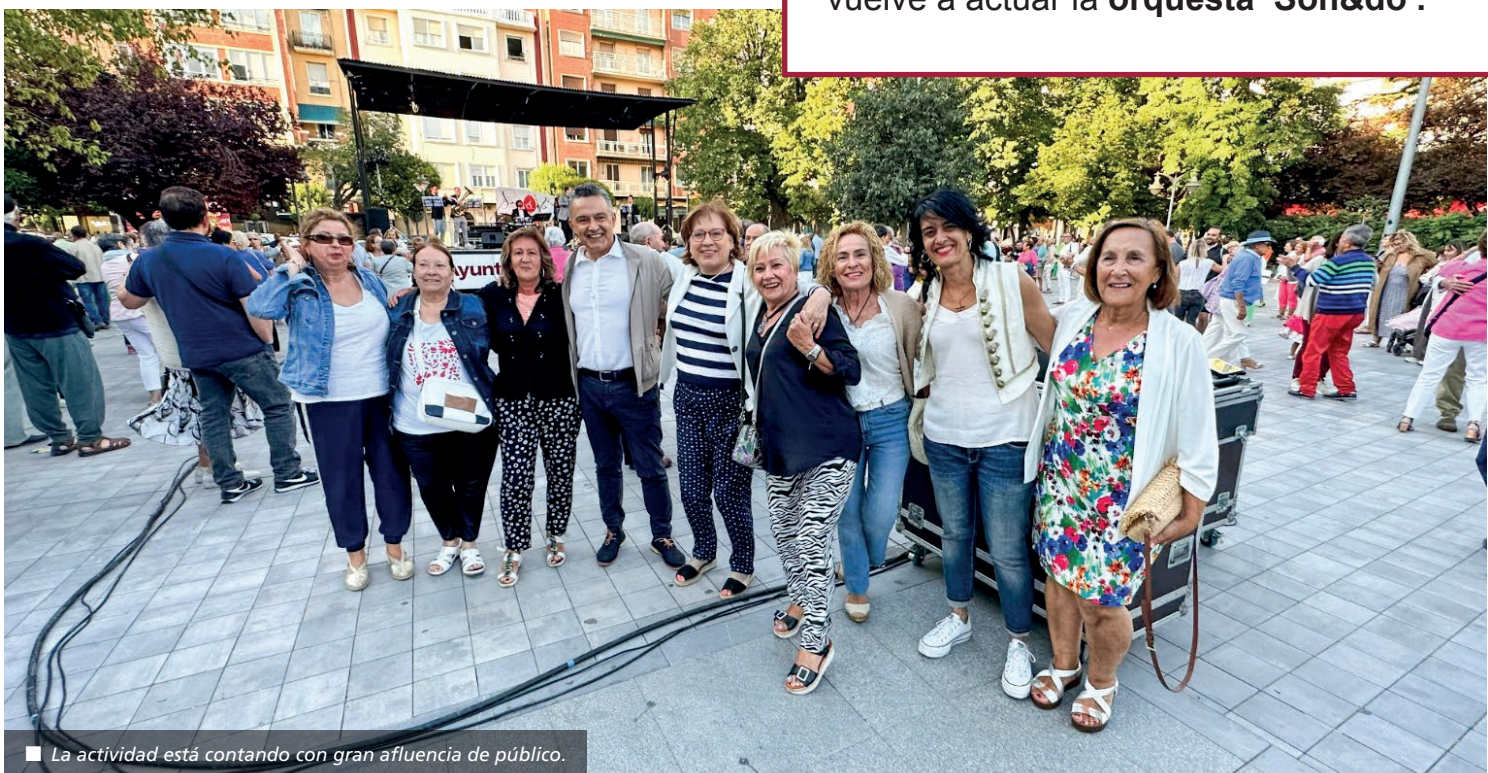
■ La actividad está contando con gran afluencia de público.