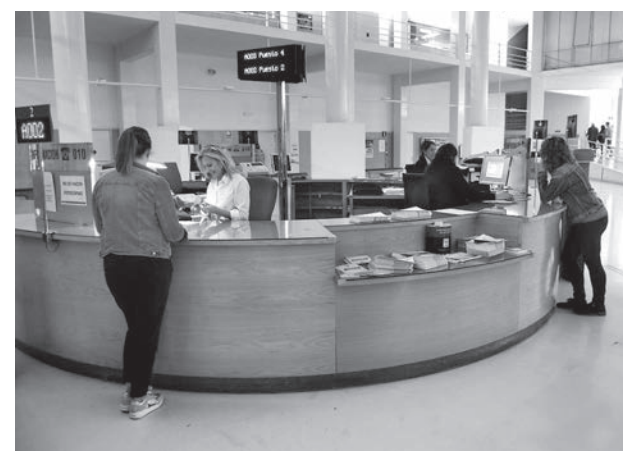
■ Puesto de atención al público de Estadística.