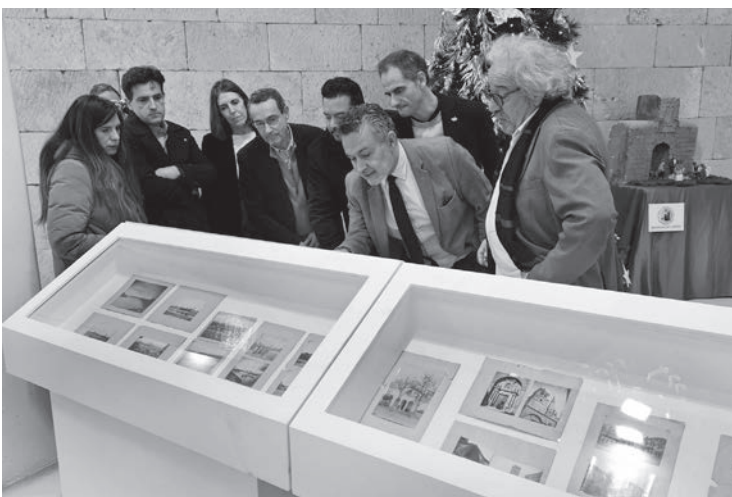
■ El alcalde visitó la muestra para conocer de primera mano estos fondos.

Las fotografías de la exposición tienen mucho valor porque en ellas puedes ver cómo ha cambiado la ciudad. Las fotografías son de los mejores fotógrafos logroñeses. Muchas de ellas estaban guardadas y todavía no las había visto mucha gente.