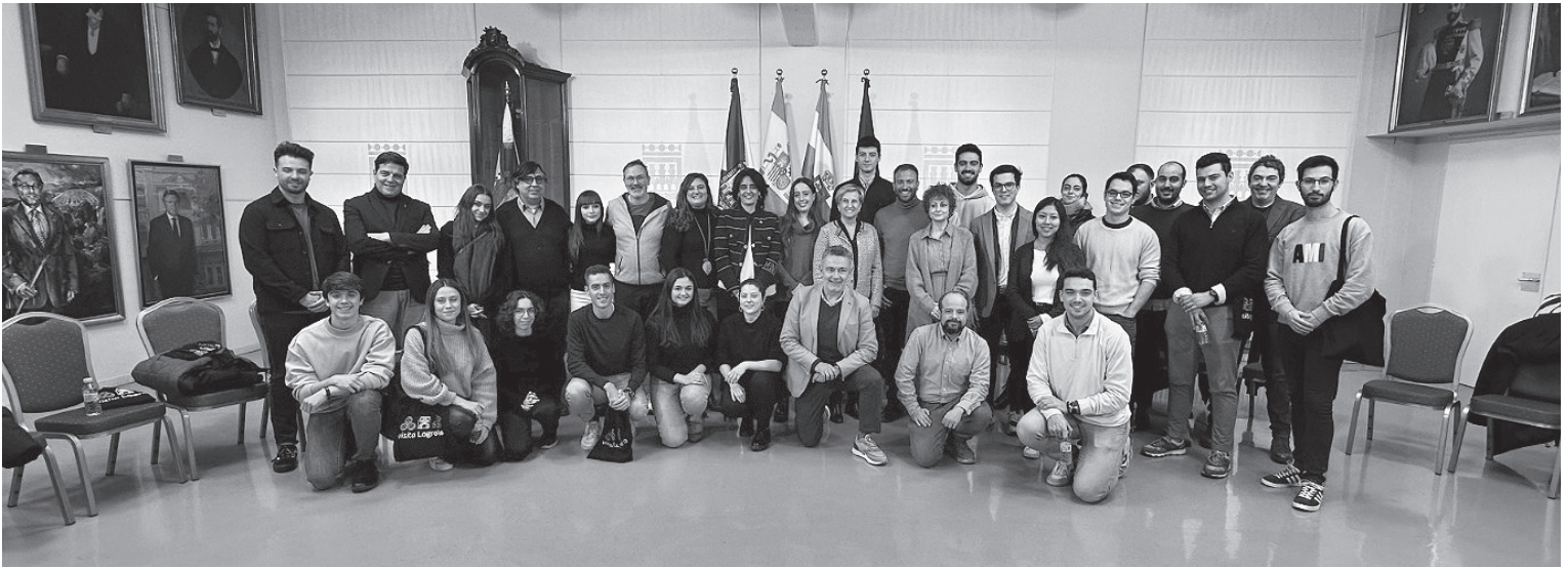
■ Miembros de la Corporación y jóvenes logroñeses que participaron en el encuentro.

Como método de colaboración de cara al futuro, el alcalde avanzó que “nos ponemos a trabajar desde ya en la elaboración de una lista de contactos de todos los asistentes y nuestra misión es provocar que ese grupo sea razonablemente activo. No se trata de aburrir con demasiadas consultas, pero sí se les va a sondear sobre temas que sean más globales, más estratégicos, y que tengan que ver el devenir de la ciudad, como pueden ser algunas cuestiones referidas al suelo industrial, que nos permitan avanzar en temas como un ‘hub empresarial’ que ha salido en la reunión y darle una concreción física urbanística a ese tipo de instalaciones”.