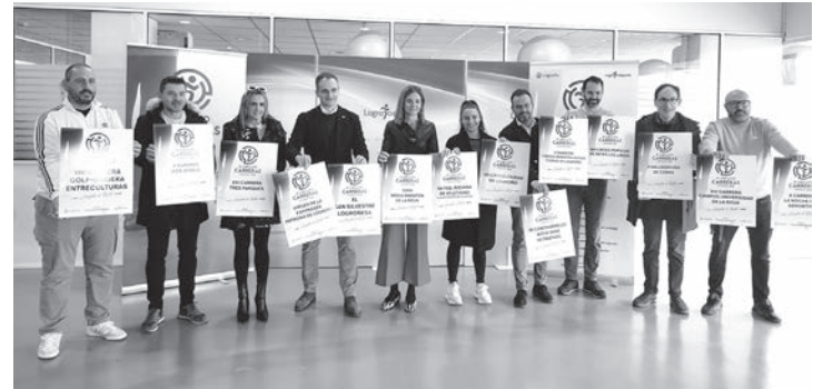
■ Representantes de las distintas carreras muestran los carteles de las mismas.

Logroño Deporte aglutina el circuito global de carreras de la ciudad, un circuito consolidado que incluye todo tipo de carreras, de montaña, maratones o carreras más cortas adaptadas al público general, y en el que se premia la constancia y el espíritu de participación. Más información en www.logrono.es .