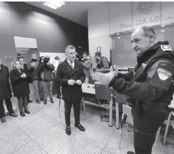
■ La comisaría reabierta en Villegas refuerza la seguridad en la zona este de Logroño.

Las Policía Local de Logroño volverá a contar con una comisaría abierta al público en la zona de Villegas. El puesto contará con atención de lunes a sábado entre las 7:00 y las 21:00 horas.