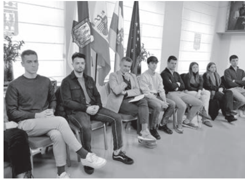
■ El alcalde escuchó las propuestas de los jóvenes.

“Esta red estará abierta a la incorporación de otras personas de similares perfiles, que