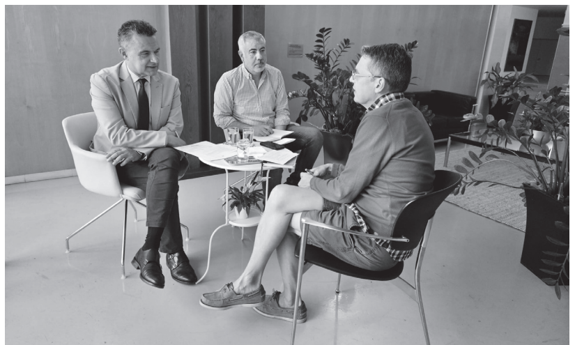
■ Encuentro celebrado en uno de los ‘Sábados del Vecino’.

Para participar en los ‘Sábados del vecino’ existen tres vías de inscripción: el teléfono 010, el canal de Whatsapp municipal (618 700 010) y un correo electrónico habilitado específicamente para esta iniciativa: sabadodelvecino@logrono.es .