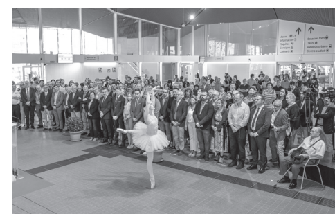
■ Imágenes de la inauguración de la estación.