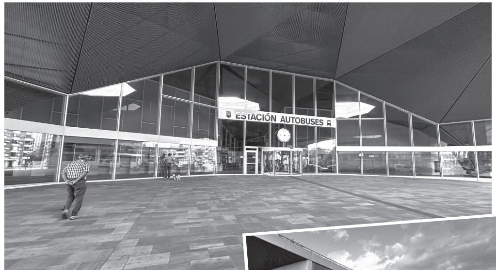
■ Entrada a la nueva estación de autobuses y aparcamiento anexo.

Asimismo, en esa fecha ya estará abierto el nuevo aparcamiento habilitado en el solar anexo a la estación. Contará con zonas de aparcamiento de tiempo limitado para los