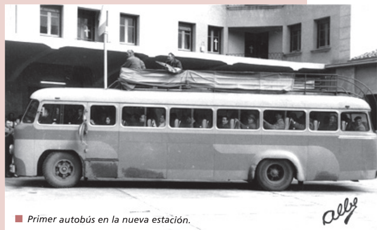
■ Primer autobús en la nueva estación.

13 horas tras cortarse la consabida cinta con los colores de la bandera y mientras la banda interpretaba el himno. El servicio de autobuses disponía de 40 líneas concedidas a 31 empresas que realizaban un promedio de 70 llegadas y 70 salidas diarias, de y a todos los pueblos de la provincia y a numerosos de Álava, Navarra, Burgos, Guipúzcoa y Soria, amén de servicios directos a Pamplona, Vitoria y San Sebastián, transportando un millón de viajeros al año y un buen volumen de mercancías.