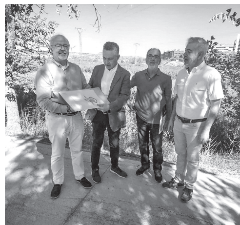
■ Presentación de proyecto del nuevo Parque del Camino.

El Parque del Camino contará con señalización e información de la Ruta Jacobea y se