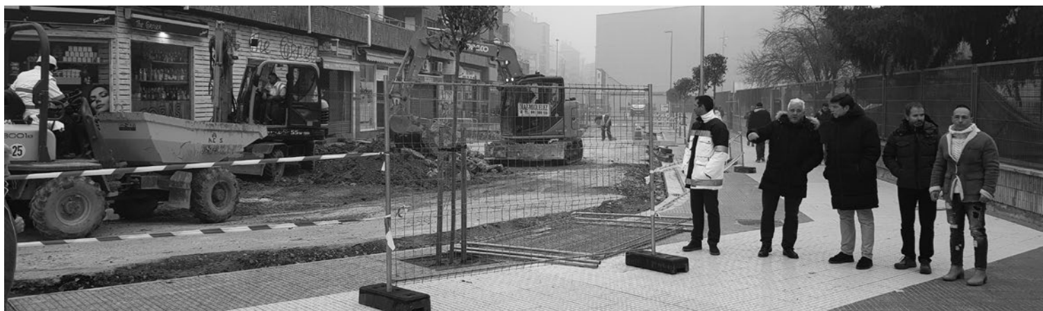
Responsables municipales visitan las obras de la calle Albia de Castro.