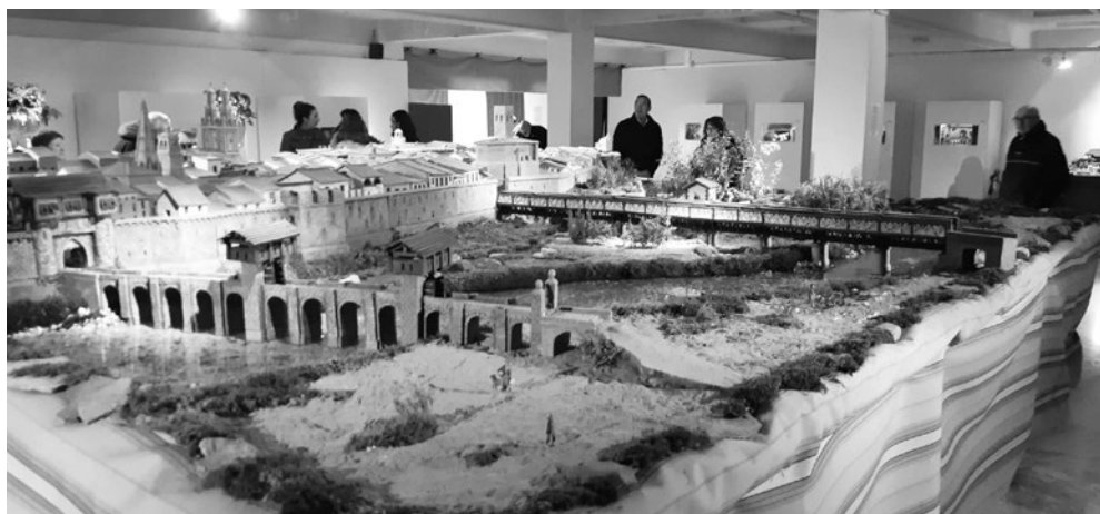
Maqueta de 'Logroño en miniatura'.

Ahora, el Ayuntamiento de Logroño, consciente del gran atractivo que tiene para la ciudad,