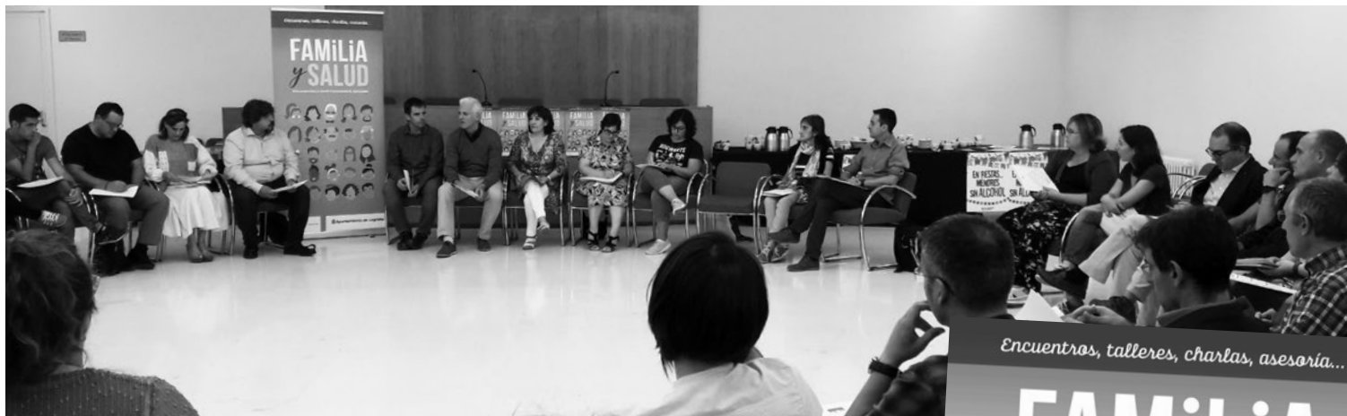
Acto de presentación del programa 'Familia y Salud' a las AMPAS y centros escolares.