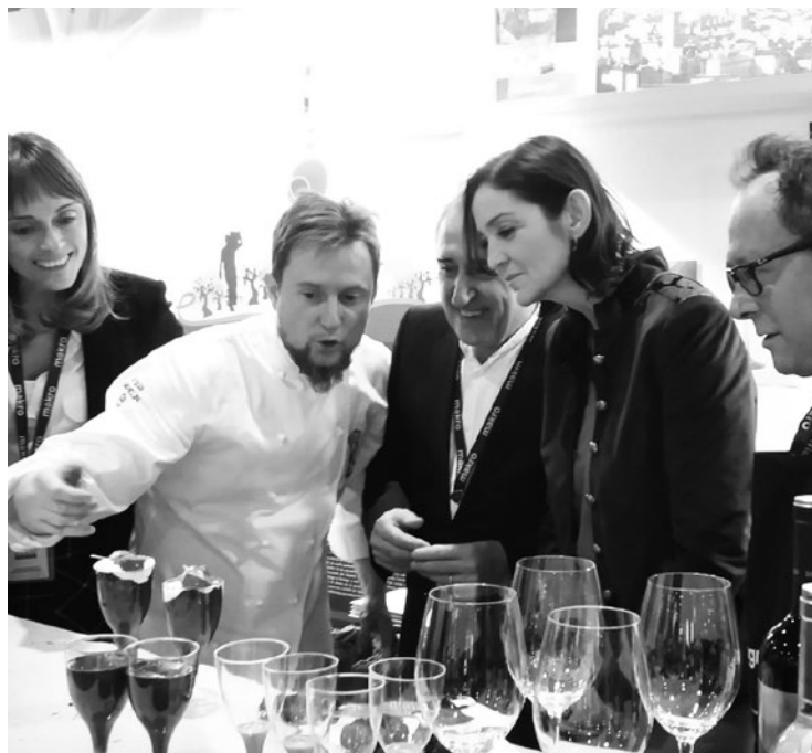
La ministra de Industria, Reyes Maroto, conoce la propuesta gastronómica de Logroño de la mano del chef Ramón Piñeiro.

También contó con la degustación realizada por el especialista en cócteles Chema Rello de su propuesta 'Rioja preparado', cuyo ingrediente principal es el vino ecológico de la variedad tempranillo blanco. Un producto sencillo, fresco y sorprendente. Además, Logroño ha