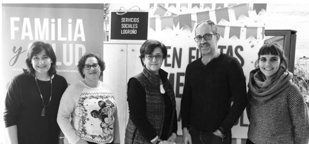
Personal encargado del área de Salud del Ayuntamiento.

Otro programa veterano es el X Fin es Sábado , que ofrece un tiempo libre saludable para adolescentes a partir de 12 años, con acceso gratuito al polideportivo IX Centenario los sábados por la tarde entre octubre y marzo.