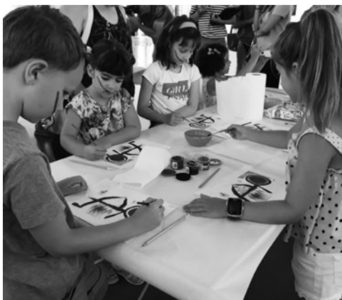
La Sala Amós Salvador ofrece una programación para todos los públicos.

Un total de 50.297 personas se han acercado durante el año 2019 al mundo del arte contemporáneo en la Sala Amós Salvador, espacio de referencia de la cultura en Logroño.