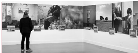
Fronteras, de Cristina de Middel y Santiago Sierra. Hasta el 9 de febrero.