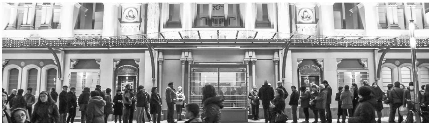
El Teatro Bretón cuenta con una programación cultural todo el año.