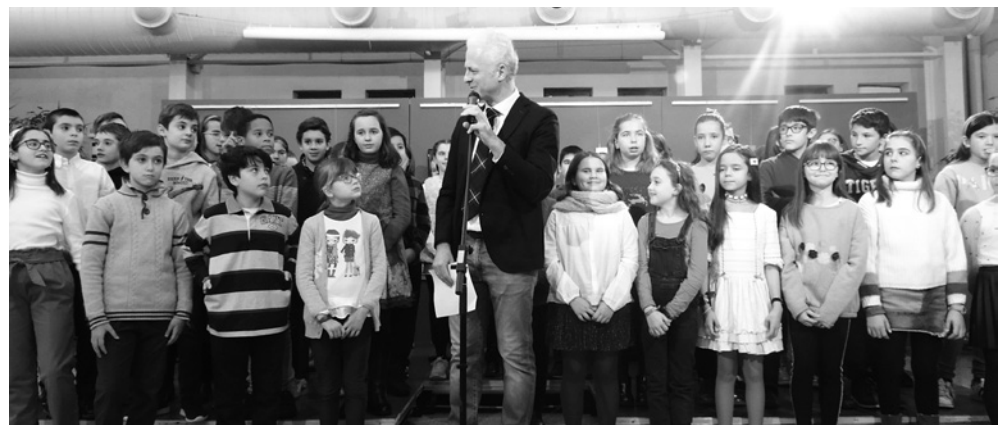
El alcalde de Logroño se dirige a niños y niñas de Logroño.

como motor de transformación social contribuye a mejorar la vida de las personas y de las comunidades y a desarrollar el potencial de sus habitantes.