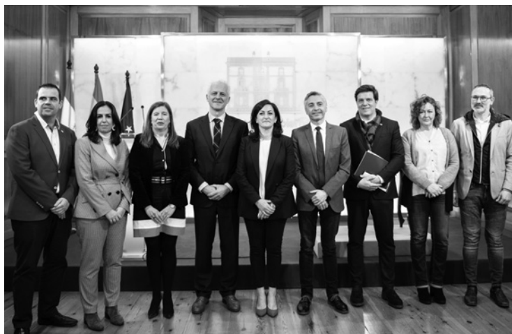
Representantes del Gobierno de La Rioja y del Ayuntamiento de Logroño.

Para la firma del Convenio se recupera la figura del Consejo de Capitalidad, órgano colegiado de carácter permanente creado para la coordinación entre el Gobierno de La Rioja y el Ayuntamiento de Logroño sobre las responsabilidades derivadas de la capitalidad autonómica de Logroño.