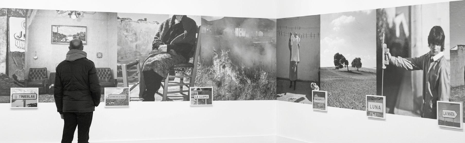
Imágenes expuestas en la Sala Amós Salvador.