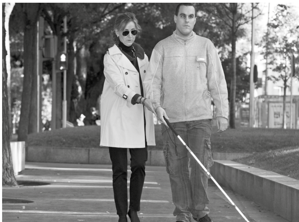
Logroño, reconocida como 'Ciudad Mapcesible'.

Existen plazas de aparcamiento para personas con movilidad reducida y este último semestre se han creado y adaptado un total de 44 plazas más en la ciudad, enmarcadas en el proyecto 'Creación y adaptación de plazas de aparcamiento para personas con movilidad reducida'. Además, los vehículos para el transporte de personas con movilidad reducida provistos de la Tarjeta Europea de Estacionamiento y de la Tarjeta Especial de Movilidad Reducida pueden aparcar el doble del tiempo