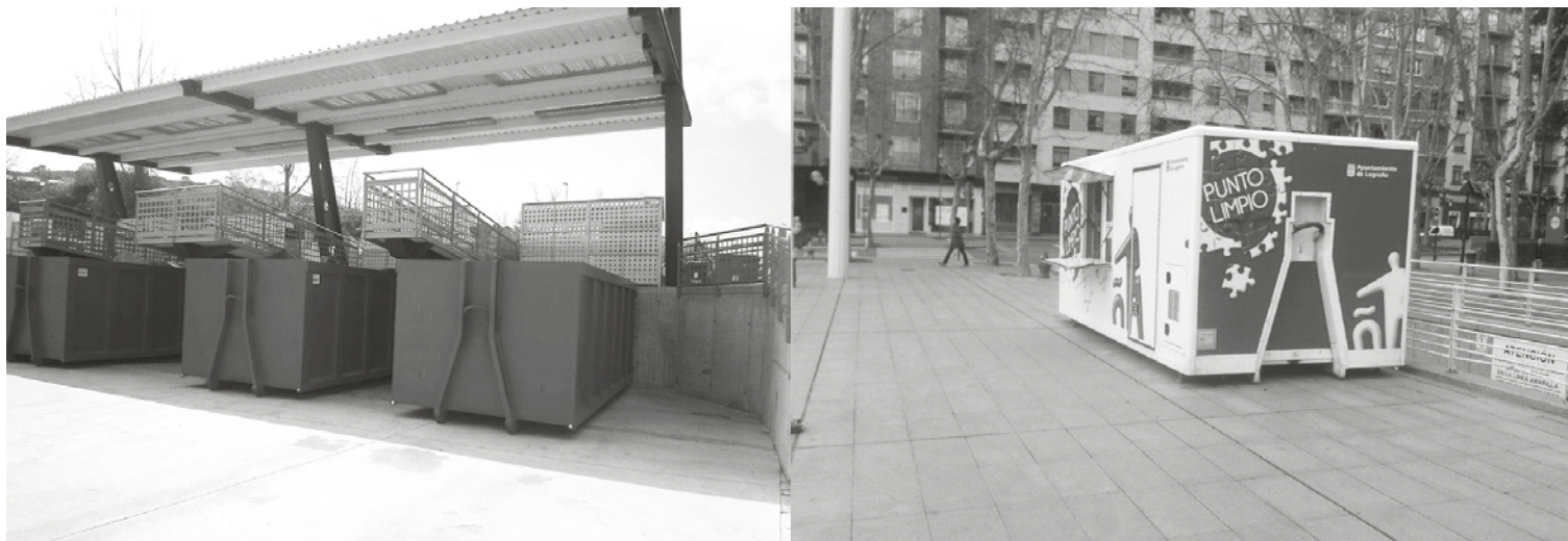
El punto limpio fijo y uno de los puntos limpios móviles.