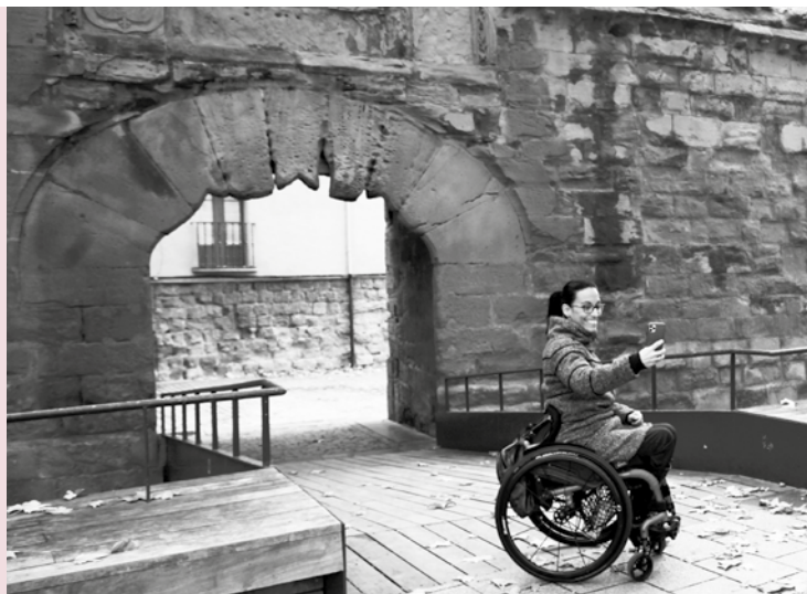
La medallista Teresa Perales junto al Arco del Revellín.

Estas y otras actuaciones han servido para obtener el reconocimiento de 'Ciudad Mapcesible' que otorga Fundación Telefónica a las ciudades más accesibles de España. Esta entidad ha valorado la labor de sensibilización en la accesibilidad de los espacios públicos de Logroño.