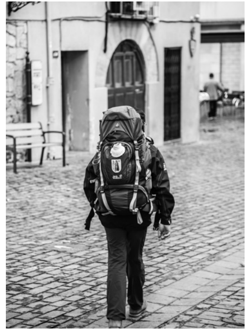
Un peregrino a su paso por Logroño.

La campaña está formada por una acción de cartelería en el ámbito de la prevención y seguridad en el Camino de Santiago; jornadas técnicas formativas para agentes de la Guardia Civil de las Comandancias de cinco comunidades autónomas del Camino; y nuevas funcionalidades de la aplicación de la Secretaría de Estado de Seguridad 'Alertcops' y la aplicación para peregrinos 'APPCamino' de la AMCS, además de una serie de mejoras en los planes de seguridad.