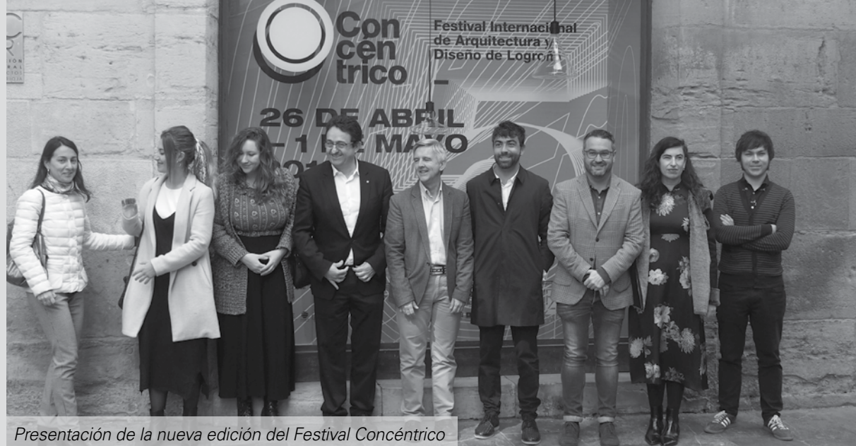
Presentación de la nueva edición del Festival Concéntrico

A los patios y plazas que permanecen más alejados en el día a día de la ciudad, se suman nuevos espacios que por su valor patrimonial, urbanístico, espacial e histórico forman parte del recorrido propuesto a los visitantes y ciudadanos a modo de descubrimiento arquitectónico de la ciudad.