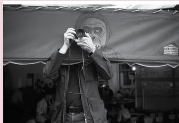
Elliott Erwitt, Autorretrato. Saint-Tropez, Francia. 1979

Players . Producida por Fundación Telefónica y organizada por Cultural Rioja. Selección de fotografías de la agencia de fotografía Magnum. Hasta el 17 de febrero de 2019