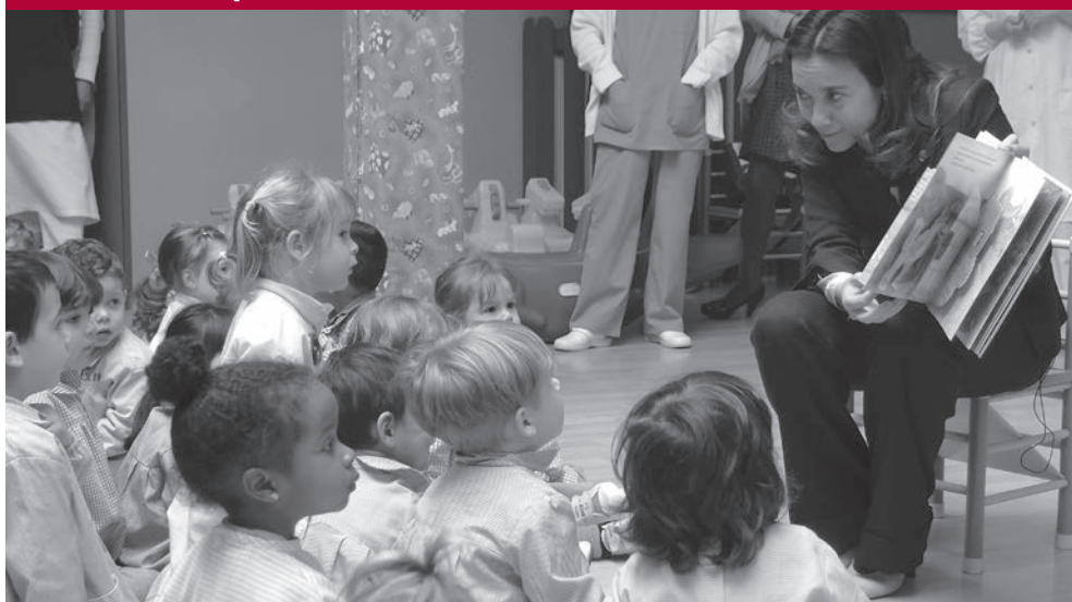
La alcaldesa de Logroño leyó un cuento a los niños de la guardería 'Chispita'

La ciudad de Logroño celebró el 23 de abril el Día del Libro para incentivar el placer de la lectura con numerosas actividades