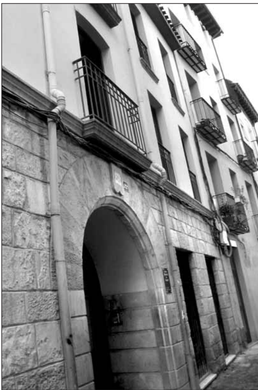
Centro municipal de Acogida

D urante la segunda quincena de septiembre y la primera de octubre llegan a Logroño personas en busca de trabajo temporero en la vendimia. Para atender a estos trabajadores y facilitarles la búsqueda de empleo, la concejalía de Derechos Sociales, en coordinación con otras entidades y con colectivos de voluntariado, ha puesto