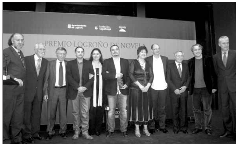
Los miembros del jurado y representantes del Ayuntamiento, la Fundación Caja Rioja y la editorial Algaida posaron junto al premiado.

El libro 'Punto de fisión' , premiado con 90.000 euros, será publicado la próxima primavera por Algaida.