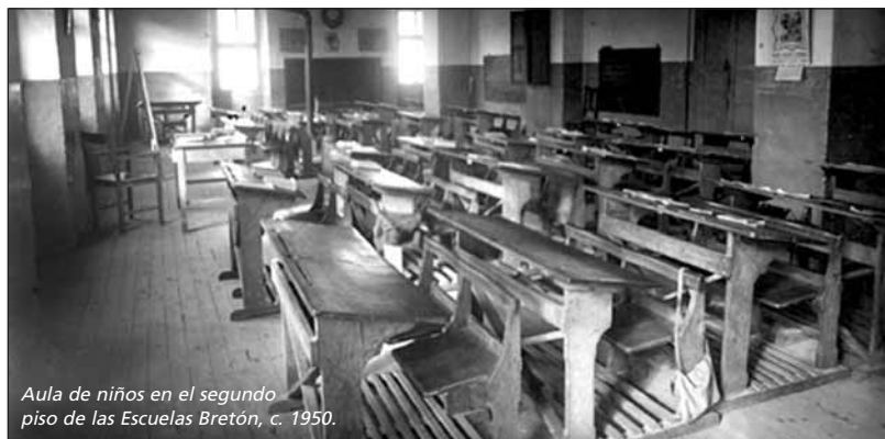
Aula de niños en el segundo piso de las Escuelas Bretón, c. 1950.