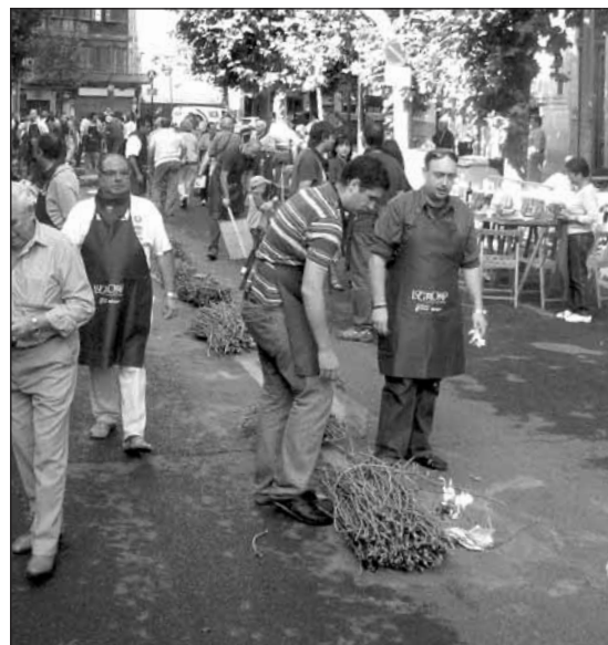
Numerosas cuadrillas participaron en la anterior edición de la Exaltación de las Chuletillas asadas.

Por otra parte, el 25 de septiembre a partir de las 11 horas se celebrará en la Avenida de Colón la II Exaltación de Chuletillas Asadas. Los grupos que deseen inscribirse podrán hacerlo en Logroño Turismo. El precio de inscripción es de 70 euros.