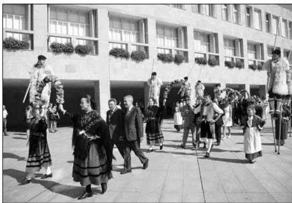
Los alcaldes de Logroño y Dax, acompañados por grupos de danza de las dos localidades.

A continuación, el salón de plenos del Ayuntamiento de Logroño acogió una sesión especial en la que intervinieron los alcaldes de las dos localidades hermanadas, y Gabriel Bellocq recogió