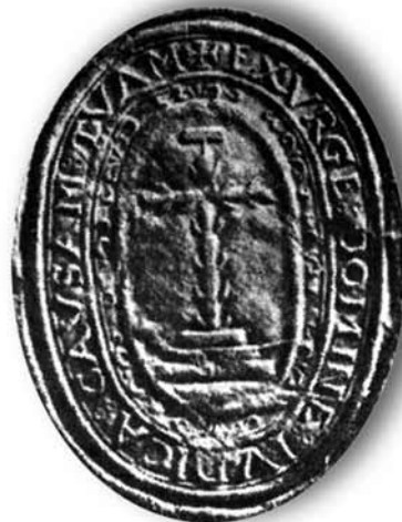
Sello del Tribunal del Santo Oficio de Logroño.

El Tribunal y la cárcel se ubicaban en la calle Norte esquina calle Intendencia, justo frente al Cubo del Revellín. La Casa de la Penitencia se hallaba en la actual calle Once de Junio. Además, el Santo Oficio poseía otros edificios y bienes muebles por la ciudad como parte de su patrimonio y como fuente de ingresos. El de Logroño contaba con tres in-