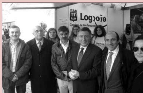
11.000 visitas al stand de información municipal

El pasado fin de semana se celebró en el Espolón la séptima edición de la feria de oportunidades Logrostock, con 240 comercios participantes y que ha rebasado este año la cifra de 210.000 visitantes. Unas 11.000 personas acudieron al puesto del Ayuntamiento para obtener información sobre actividades municipales y para registrarse como Voluntarios de Logroño.