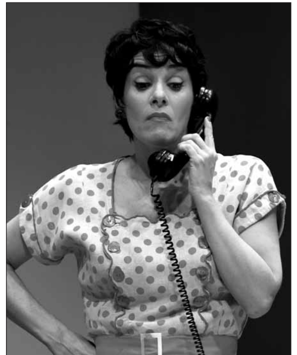
■ La actriz Anabel Alonso en una escena de la obra "Nunca estuviste tan adorable".