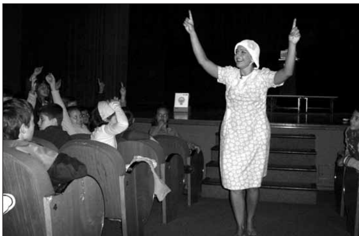
La OMIC programa cursos para enseñar a ser buenos consumidores.

Complementariamente, el día 10 de noviembre se inicia el taller sobre 'Accidentes con productos de consumo', en el que se enseñará a los escolares de 5º de Primaria a revisar adecuadamente el etiquetado de los productos y prevenir así posibles accidentes. Finalmente, durante la segunda quincena de noviembre, y aprovechando la proximidad de las fiestas navideñas, el taller 'Los juguetes y la Navidad', dirigido a los alumnos de 6º de Primaria, les dotará de herramientas críticas para analizar la publicidad y el etiquetado de los juguetes.