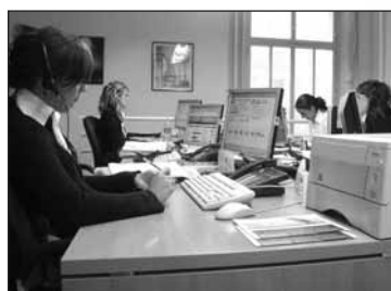
■ Las teleoperadoras del 010, en plena jornada de trabajo.

un anciano que, según él mismo afirma, "está para cuidarles", y cada cierto tiempo se encarga de traerles las mejores pastas o frutas para amenizar su trabajo.