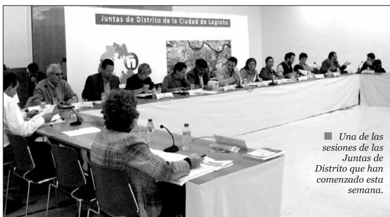
■ Una de las sesiones de las Juntas de Distrito que han comenzado esta semana.

También les corresponde a los representantes de las Juntas de Distrito aprobar las nuevas normas de funcionamiento de las Juntas, que darán mayor agilidad y eficacia a este órgano en el que están representados colectivos vecinales, gremiales, cultura-