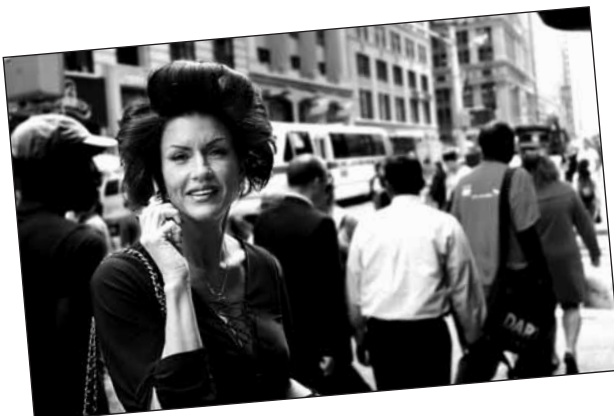
Primer Premio V Edición del Concurso Nacional de Fotografía Objetivo Mujer. Obra de José Ramón Martínez Sáenz.

El VI Concurso 'Objetivo Mujer' tiene como tema este año 'Mujeres de allá y de aquí' y utiliza como medio de expresión la fotografía, de manera que pueda participar cualquier persona que quiera captar con una cámara lo que piensa o siente. Las fotografías deberán reflejar las diversas situaciones que viven las mujeres en nuestro país desde una perspectiva multicultural. Todos los participantes deben entregar tres fotografías como máximo antes del 12 de noviembre. Se establecen tres premios: primer premio de 600 euros; segundo de 500 euros; y tercero de 400