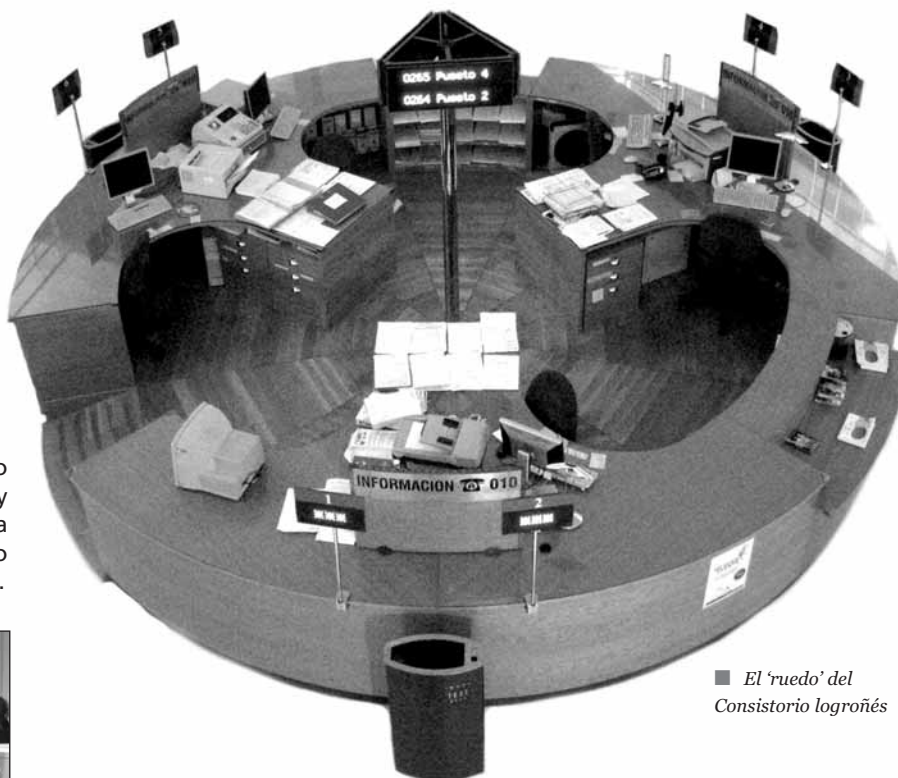
■ El 'ruedo' del Consistorio logroñés

La primera voz y la primera cara con la que contacta el ciudadano cuando se dirige al Ayuntamiento de Logroño la encuentra en el 010. Este servicio, que hoy está de aniversario, y que puso en marcha la Corporación presidida por José Luis Bermejo, se ha consolidado durante diez años como la voz amable y humana del ámbito municipal, que tiende la mano hacia todos los trámites administrativos. Una especie de 'sabelotodo', conformado por una plantilla de doce personas, que se encarga de múltiples tareas: desde ofrecer información telefónica y presencial sobre gestiones o actividades diversas que se desarrollan en la ciudad, hasta la realización de trámites e inscripciones. Y siempre coordinados por la Unidad Municipal de Participación Ciudadana.