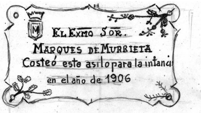
■ Boceto de la placa conmemorativa de la donación. AML, IGE 440/1.

El Ayuntamiento y la Junta Directiva de la Cuna de Jesús no llegaron a un acuerdo sobre la gestión conjunta