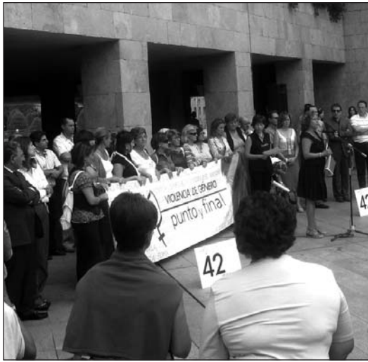
■ Concentración de septiembre contra la violencia machista.

Las mujeres víctimas de la violencia de género que denuncien a sus agresores podrán a partir de ahora contar con la guía de apoyo 'Guía para protegerte de la agresión' . Esta publicación pretende informar y transmitir a estas mujeres que, al igual que han sido protagonistas denunciando su situación, continúan siendo una parte activa muy importante de su propia protección. Precauciones que puede tomar en sus actividades cotidianas, cómo reaccionar en caso de que sienta riesgo a sufrir una agresión, o incluso en caso de que la sufra, son algunos de los puntos que se abordan en esta guía. Un material que será complementario y servirá de apoyo a la Policía Nacional cuando la víctima interpone la denuncia y a la Policía Local cuando se le asigna un agente. La guía ofrece indicaciones sobre qué hacer en las distintas situaciones asociadas a la violencia de género, e informa sobre cuándo acudir a la Policía o a los Servicios Sociales.