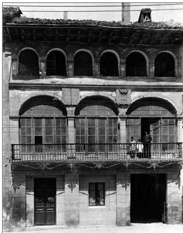
■ Esta fotografía, conservada en el Archivo Municipal, nos muestra cómo era el Portalón. Puede observarse en la fachada la existencia de un escudo de la ciudad.

El sobrenombre de 'El Portalón' fue debido a la función de comunicación que realizaba entre la calle Portales y la calle Caballerías: por su planta baja, a través de su portón o portalón, se podía pasar de una calle a la otra. Precisamente esa función fue lo que motivó la desaparición del edificio. El uso se impuso a la construcción, y en 1915 fue derribado para prolongar la calle Juan Lobo hasta Portales.