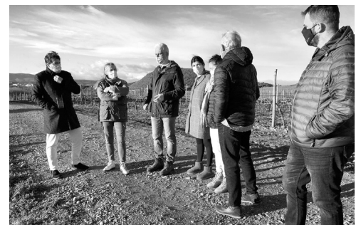
■ El alcalde, Pablo Hermoso de Mendoza, junto a representantes vecinales de El Cortijo.

Pablo Hermoso de Mendoza les ha avanzado que el Ayuntamiento de Logroño mantiene conversaciones con la Diputación de Álava para estudiar una colaboración y proyectos comunes de recuperación del entorno. También han abordado otras actuaciones municipales en el barrio de El Cortijo.