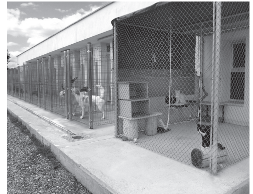
■ Centro de Acogida de Animales de Logroño.

Además, en 2020 se registraron 232 entradas de perros en el Centro de Acogida y 240 salidas (76 fueron recuperados por sus propietarios; 56 adopciones a particulares y 77 adopciones a protectoras). Respecto a los gatos, se contabilizaron 132 entradas y 139 salidas, frente a las 161 entradas de 2019. De estos gatos, 7 fueron recuperados por sus propietarios o propietarias; 28 fue-