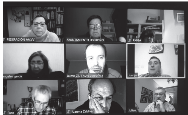
Reunión entre el Ayuntamiento y representantes vecinales y comerciantes.

Por otra parte, el Ayuntamiento de Logroño ha realizado el último pago del soterramiento a LIF, cuya cuantía asciende a 4.299.111,22 euros en concepto del préstamo participativo para el soterramiento. El Consistorio logroñés, además, afronta este año el último pago de la obra, que supone un total de 34 millones euros.