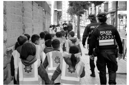
■ Agentes de la Policía Local en una sesión formativa de educación vial a escolares logroñeses.

En los encuentros, se les mostró también “cómo deben viajar en la parte de atrás de un vehículo, si deben usar dispositivos móviles, la necesidad de tener un comportamiento correcto durante los viajes y cómo debe ser su actitud con los conductores de los vehículos, intentando reforzar el mensaje de respeto a las normas de tráfico, con el objetivo de que interioricen la responsabilidad que conlleva”, ha indicado la concejala