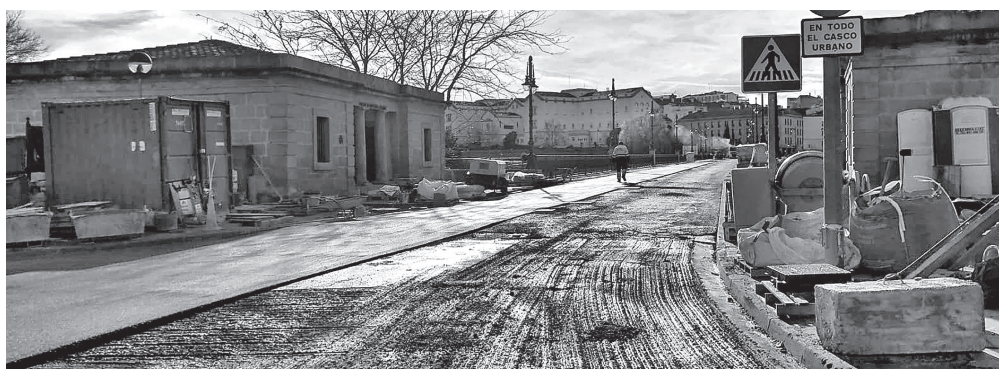
Estado actual de las obras de restauración del Puente de Piedra.

Además de la limpieza de humedades y la restauración de sillares con problemas de erosión, los trabajos se han centrado en la plataforma superior, que contará con una