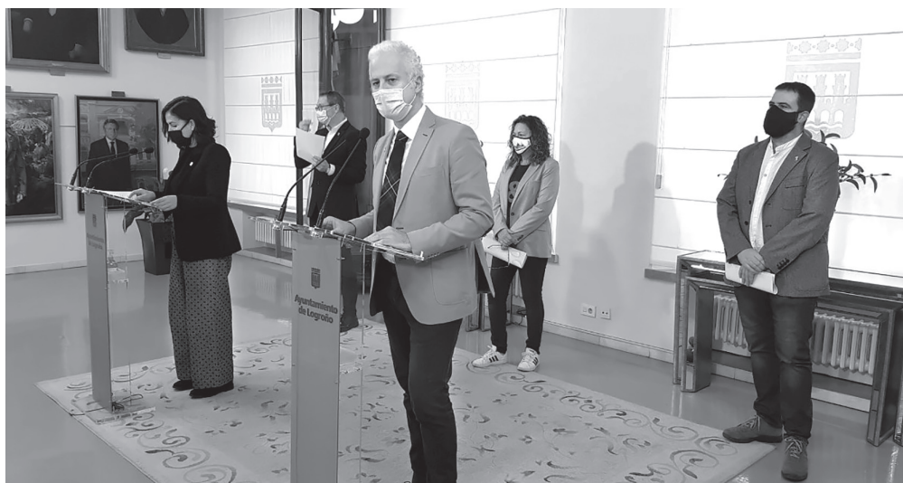
■ El alcalde, la concejala de Economía y Hacienda y los portavoces de los grupos municipales del PSOE, UP y PR+, en la presentación de los presupuestos del Ayuntamiento para 2021.

El Presupuesto para 2021 apoya a sectores golpeados por la crisis como son el comercio, la hostelería y el sector turístico mediante dotaciones de dinamización comercial, formación en el empleo y autoempleo, la creación de subvenciones para el sector del turismo y su promoción, mayores bonificaciones fiscales para el comercio y atención a la hostelería en un marco de incertidumbre generalizada.