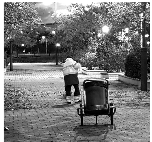
Personal de limpieza del Ayuntamiento en el barrio El Campillo.

La modificación del contrato, aprobada por la Junta de Gobierno, también incluye la puesta en marcha, el 1 de febrero de 2021, de la recogida piloto de residuos de materia orgánica, mediante la colocación de diferentes contenedores en dos zonas diferenciadas del sur de la ciudad, por un importe anual de 240.007 euros. Tras esta prueba piloto, el objetivo es hacerlo extensible a toda la ciudad cuando sea de carácter obligatorio por normativa.