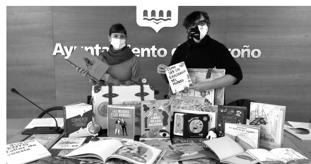
La concejala de Cultura y la directora de la biblioteca, en la presentación de la iniciativa.

Para poder solicitar su préstamo, es necesario que el centro escolar, asociación o familia tenga su carnet institucional de la biblioteca. Los solicitantes se harán cargo tanto de la recogida como de la entrega de cada 'maleta viajera'. Cada centro puede decidir que los alumnos y alumnas tomen presta-