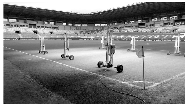
Carros de luz y calor en el césped de Las Gaunas.