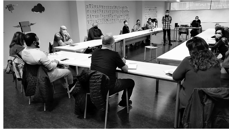
■ Participantes del segundo curso de 'Hola Barrio', en la Biblioteca Rafael Azcona.

Esta radio se ha hecho dentro del Proyecto Comunitario Intercultural de los barrios de Madre de Dios y San José. Es un proyecto para mejorar la convivencia entre los vecinos y vecinas y tiene el apoyo del Ayuntamiento de Logroño, Gobierno de La Rioja, Fundación 'la Caixa' y Rioja Acoge.