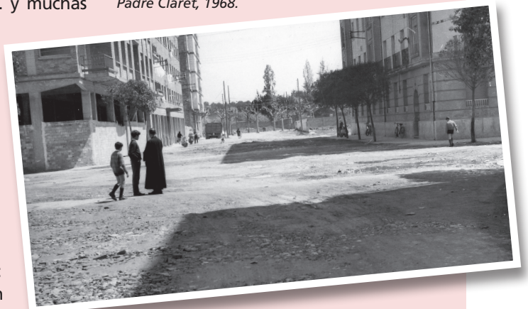
Duquesa de la Victoria esquina con Padre Claret, 1968.

La fisonomía de la calle Duquesa de la Victoria ha cambiado a lo largo del tiempo, como lo han hecho los edificios que se asoman a ella y los vecinos que la habitan y transitan.