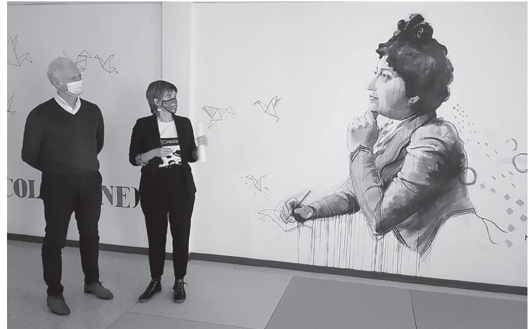
■ El alcalde y la concejala de Igualdad inauguran el nuevo Laboratorio feminista.

El espacio cuenta con cuatro estancias denominadas 'Las Hermanas Mirabal', 'Las Sinsombrero', 'Carmen de Burgos' y 'John Stuart Mill'. Son nombres vinculados a algunas cuestiones fundamentales en el recorrido hacia la igualdad de género: la prevención de la violencia machista, el papel de los medios