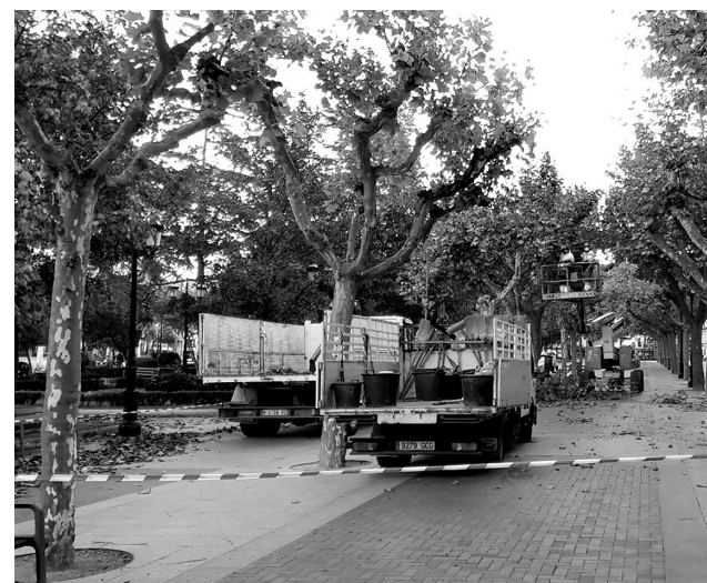
■ Trabajos de poda en El Espolón.

Con esta campaña, según el concejal, "obtendremos restos de poda de calibres menores y estos se gestionan en la planta de compost municipal. El 100% del compost obtenido retorna a las zonas verdes", ha explicado. Además de tener en cuenta criterios de eficiencia energética y respeto de la biodiversidad, esta intervención "va a ser menos intensiva, especialmente