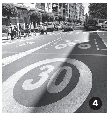
■ Calle La Manzanera. Ejemplo de vía con limitación 30 Km/h.