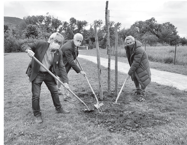
■ El alcalde, el concejal de Medio Ambiente y el director de la Casa de la Danza en la plantación.

El Bosque está situado en una parcela de 3.000 metros cuadrados en el Parque de La Ribera, junto a la Residencia Universitaria. Desde su nacimiento, el objetivo ha sido crear un bosque urbano cuyos árboles fueran donados por profesionales del mundo de la danza y que llevaran su nombre, para convertir al bosque en un gran diccionario de la danza. Hasta ahora, los árboles tienen nombres reconocidos como Ana Pavlova, Alicia Alonso, Nijinski, Antonio 'El Bailarín', Nureyev, Tamara Rojo o Lucía Lacarra, entre otros.