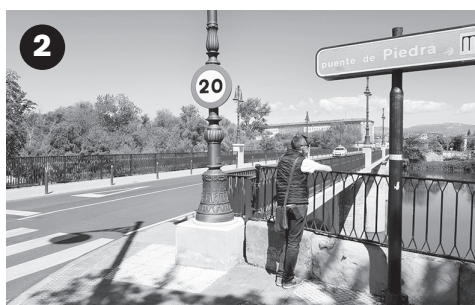
■ Puente de Piedra. Ejemplo de vía con limitación 20 Km/h.