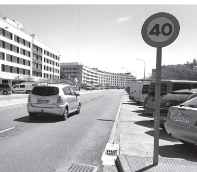
Ejemplo de vía con limitación 40 Km/h.