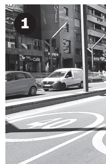
1 Gran Vía. Ejemplo de 40 Km/h y 30 Km/h