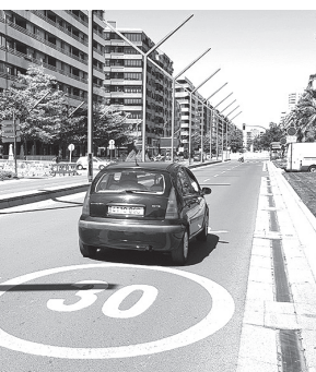
Ejemplo de calle con limitación de 30 Km/h en el ciclocarril derecho.

Algunas calles peatonales y del Centro Histórico.