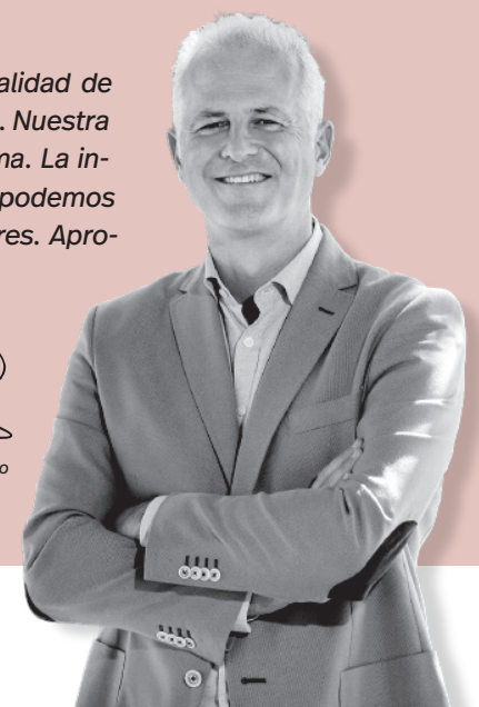
Pablo Hermoso de Mendoza / Alcalde de Logroño

el deseo de superación, la mejora en la calidad de nuestros servicios siempre será bienvenido. Nuestra cotidianidad atrae y esto es un buen síntoma. La industria de la hospitalidad sale fortalecida y podemos ser más abiertos, más cosmopolitas, mejores. Aprovechémoslo. Mejoremos.