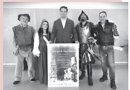
■ El concejal de Participación Ciudadana junto con miembros de Guardias de Santiago y la Asociación de Vecinos Casco Antiguo.

De este modo, a través de un completo programa de actividades, Logroño vuelve a recordar lo sucedido en el Auto de Fe de 1610, cuando se celebró el juicio y la posterior quema de once personas vecinas de la localidad navarra de Zugarramurdi acusadas de brujería por la Santa Inquisición.