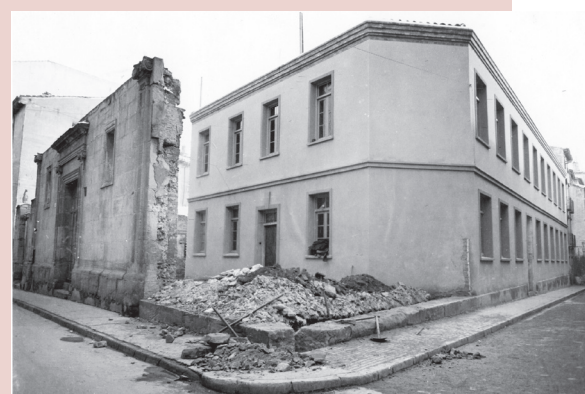
■ Colegio San Bernabé y fachada de la antigua Diputación en 1952.