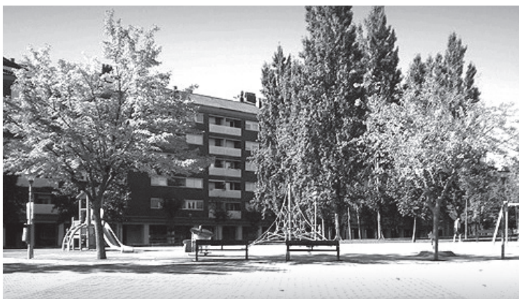
■ Las zonas de juegos del Parque San Miguel y de La Ribera-Paseo del Prior son dos de las cinco áreas que se van a arreglar.

El Ayuntamiento también acaba de arreglar el suelo de los parques infantiles de la Plaza Primero de Mayo. Y más adelante, quiere arreglar el suelo de los parques de la Plaza La Vendimia, el Paseo de la Florida-Constitución y la zona central del Parque Picos de Urbión.