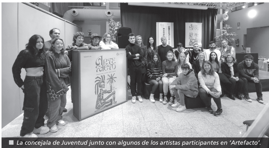
■ La concejala de Juventud junto con algunos de los artistas participantes en 'Artefacto'.

El Festival de Cultura Joven 'Artefacto' 2022 se celebra del 3 al 12 de noviembre y se convierte, un año más, en un gran escaparate en el que jóvenes creadores y creadoras de la ciudad muestran sus innovadoras y atractivas propuestas. Un total de 150 artistas jóvenes participan en este encuentro creativo organizado por el Ayuntamiento para hacer de la ciudad un espacio vivo, dinámico y participativo.