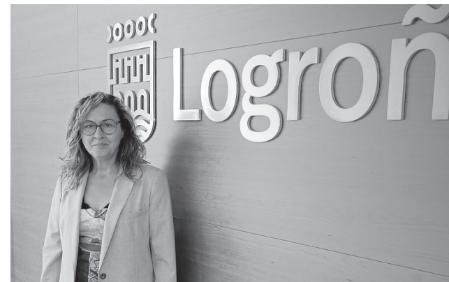
■ La concejala responsable del área de Bienestar Animal, en la presentación del proyecto.

En total, se adecuarán cerca de 17 700 metros cuadrados de espacio público para la ejecución de estas nueve zonas de esparcimiento canino, “que estarán dotadas de los elementos básicos que se han considerado convenientes, como fuentes, árboles, bancos, papeleras, zonas de sombra y de juego, entre otros, siempre teniendo en cuenta las peculiaridades, características y disponibi-