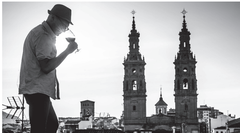
■ El programa incluye catas, visitas a bodegas, sorteos y otras actividades.

El programa incluye, entre otras actividades, visitas guiadas todos los sábados del