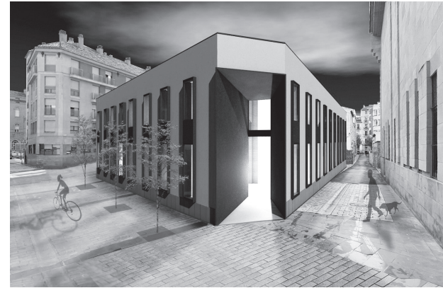
■ Imagen recreada del edificio tras su rehabilitación, que tendrá su acceso principal por la calle Rodríguez Paterna.

Para su ejecución, la Junta de Gobierno aprobó el proyecto y su licitación para la contratación de las obras, cuya adjudicación, por una cuantía máxima de 2 649 299,76 euros, se prevé para principios del próximo año. En la Villanueva ya se están urbanizando las calles Hospital Viejo y Los Yeros, y en breve, se llevarán a cabo los trabajos en las calles El Horno, La Brava y en la Plaza de la Villanueva.