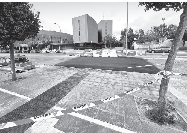
■ Obras de construcción de un nuevo paso peatonal en Las Tejeras.

El Ayuntamiento de Logroño ha iniciado la construcción de nuevos pasos peatonales para mejorar la seguridad y la accesibilidad de la ciudadanía. Las actuaciones forman parte de la estrategia del Equipo de Gobierno para tratar de reducir drásticamente el número de atropellos, así como la velocidad en las vías urbanas.