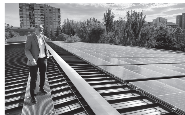
■ El concejal de Deportes visita la nueva instalación de paneles solares en el tejado de Lobete.

Logroño Deporte desarrolla un completo programa para mejorar la eficiencia energética de la red de instalaciones. Así, junto a los paneles solares de Lobete y también los instalados en La Ribera, poco a poco se