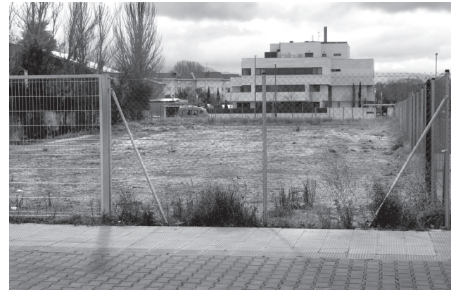
■ Solar en suelo urbano de Logroño.

Esta propuesta posibilita usos temporales como, por ejemplo, pistas agility , alguna modalidad de gimnasio outdoor con toldos o similar, huertos urbanos, o bien otros como los llevados a cabo en otras ciudades dirigidos a atender la demanda de espacios por la juventud para desarrollar su creatividad, como puntos de lectura, salas de ensayo para bandas de música, espacios de co-creación, laboratorios sociales o espacios de emprendimiento, entre otros.