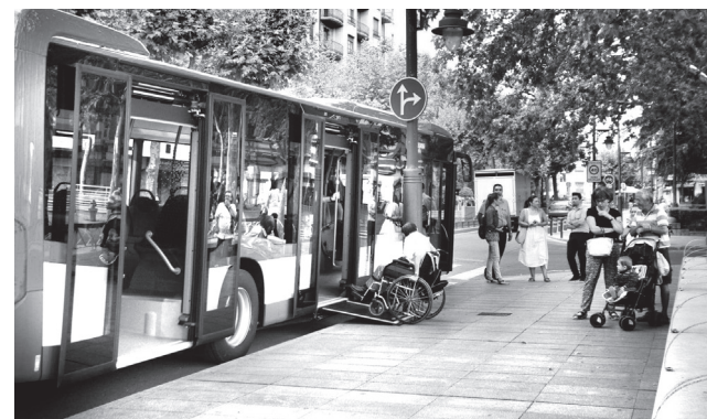
■ El proyecto permitirá renovar los sistemas de gestión de la flota de autobuses urbanos.

La plataforma proveerá de diferentes servicios de movilidad urbana en una sola aplicación: autobús, taxi, bicis, coche compartido, aparcamientos, etc. Además, permitirá a los ayuntamientos conocer los hábitos de movilidad de la ciudadanía y facilitará la toma de decisiones gracias a los módulos de gestión de big data . Este sistema permitirá también renovar los programas informáticos de gestión de la flota de autobuses, las rutas e itinerarios, la comunicación de los autobuses con la central, la medición de los tiempos por parada, el sistema de pago del billete o el sistema de recar-