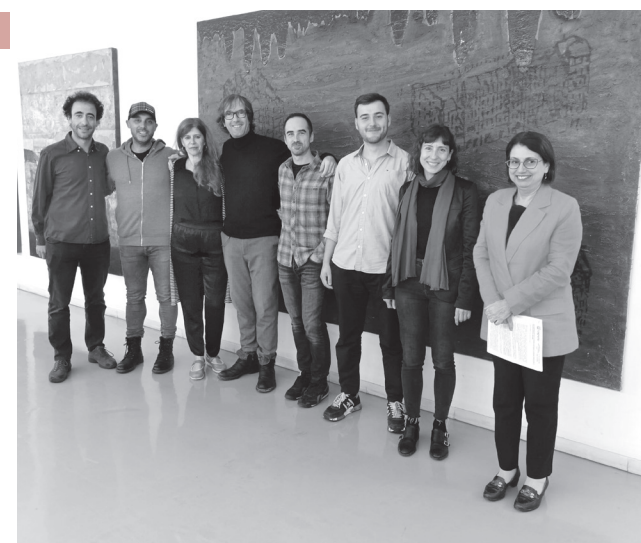
■ La concejala de Cultura, con algunas de las personas premiadas en la pasada edición.

Los proyectos premiados han de ser de nueva creación, originales e inéditos; y desarrollarse en el año 2023. El plazo para presentar las solicitudes se establece desde el 11 hasta el 31 de mayo. El modelo oficial de