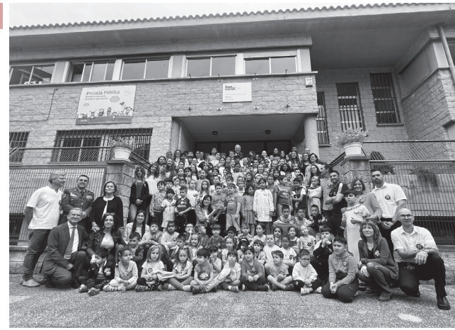
Acto de entrega del galardón de la 'Estrella de Europa' al CEIP Varia.

Además, el CEIP Varia organiza cada año una semana cultural, forma parte de la red de Centros Educativos hacia la Sostenibilidad