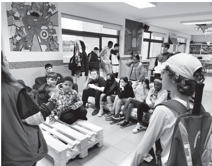
■ Centro joven Lobete

Para hacer el decálogo, los y las jóvenes participaron en un proceso para ver qué situaciones hacen que haya odio, reflexionar y pensar acciones para que haya buena convivencia.