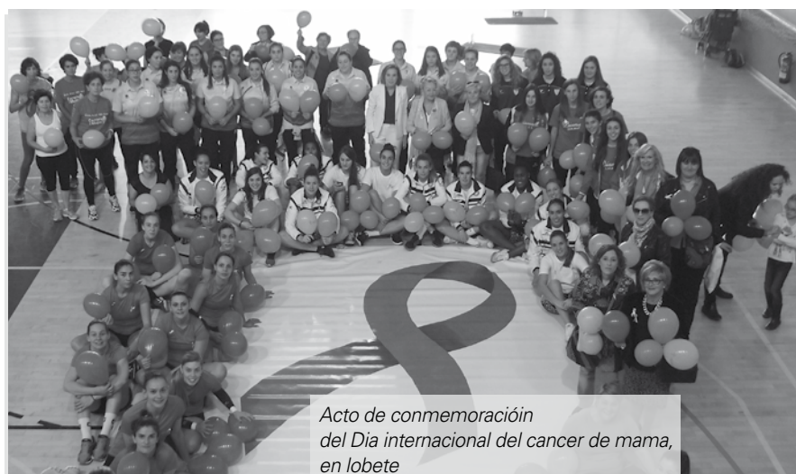
Acto de conmemoración del Día Internacional del cáncer de mama, en Lobete