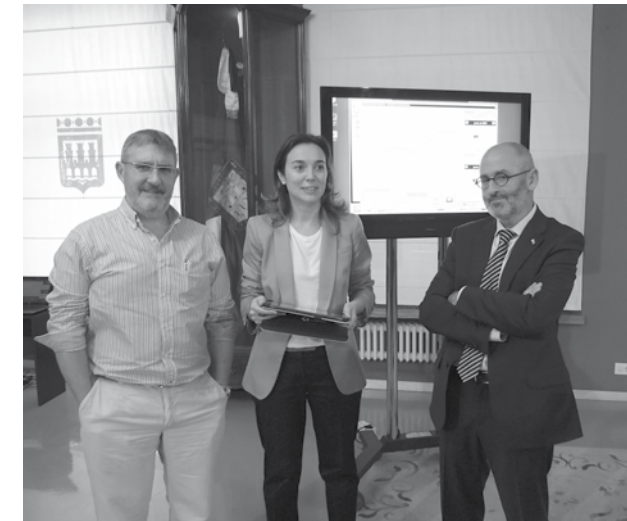
Gamarra y Ruiz Tutor, junto al representante de JMP Ingenieros

Esta necesidad se trasladó al sector privado y, en un ejemplo de colaboración público-privada, el Ayuntamiento de Logroño, junto a la empresa riojana JMP Ingenieros, ha desarrollado un sistema innovador de telegestión abierto, accesible, flexible y modificable y adaptable a cualquier equipo y servicio .