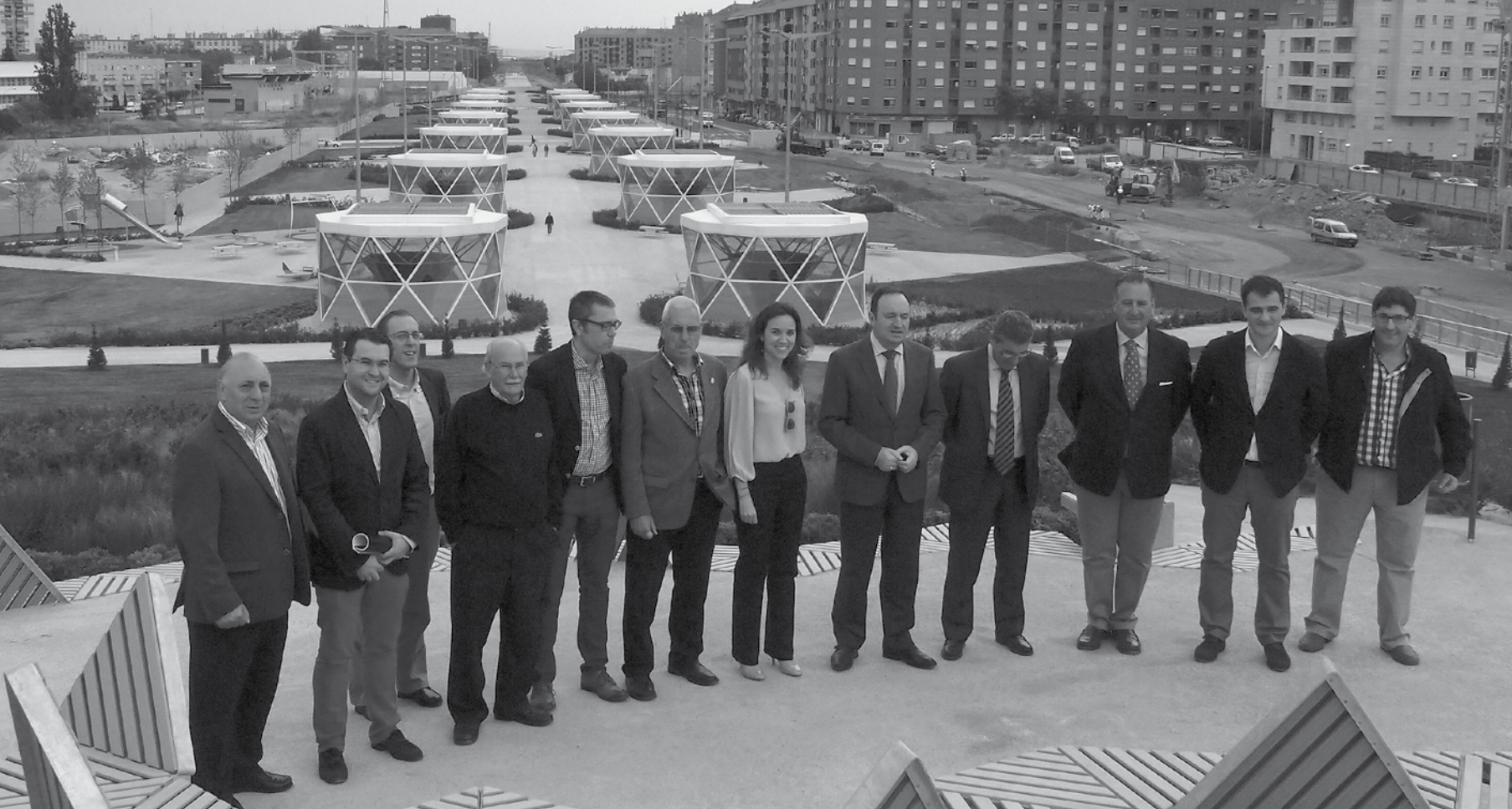
Representantes de las tres administraciones y vecinos de la zona visitaron el parque sobre el soterramiento el día de su inauguración

Esta zona verde, de más de 35.000 metros cuadrados, transforma radicalmente la zona e incrementa la calidad de vida de los vecinos