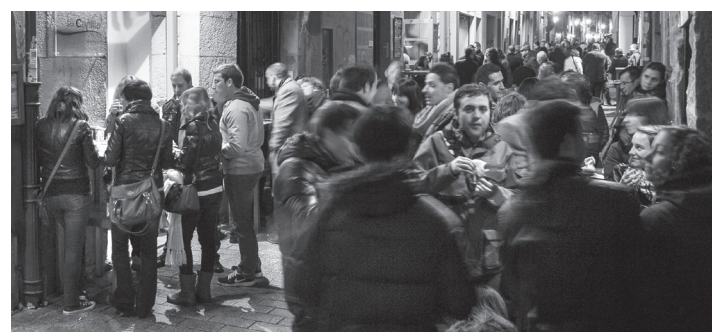
■ La calle Laurel es uno de los lugares más interesantes para los turistas por su gastronomía.

En la feria, la ministra de Industria, Comercio y Turismo, que se llama Reyes Maroto, entregará a la ciudad de Logroño el reconocimiento de la 'Red de Destinos Turísticos Inteligentes'.