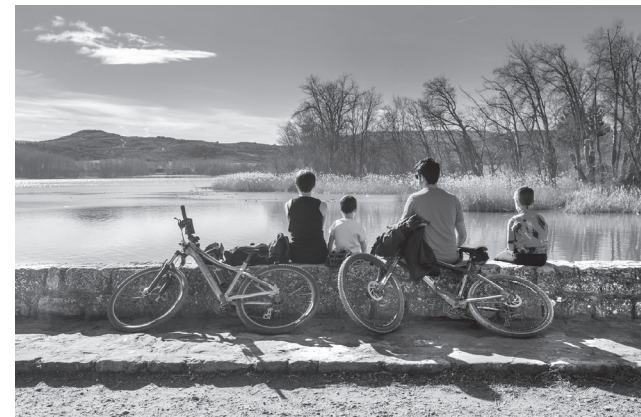
■ Parque de La Grajera

El Aula Didáctica de La Grajera está al servicio de la ciudadanía y tiene como objetivo concienciar y sensibilizar a la población e inculcar hábitos y conocimientos relacionados con el medio ambiente, mediante actividades lúdicas y didácticas, talleres