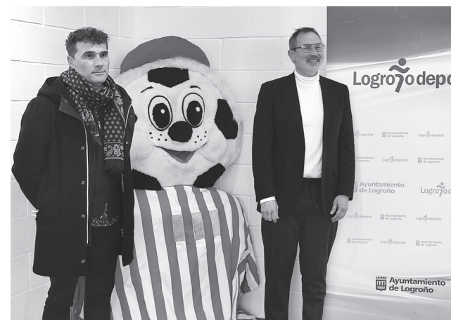
■ El concejal de Deportes y el gerente de la Fundación Caja Rioja en la presentación del proyecto.

La inauguración está prevista para la primavera, con una primera exposición que será