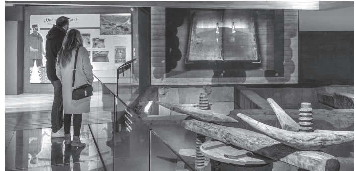
■ El turismo del vino es una de los temas más importantes que Logroño presenta en la feria.

En esta feria Logroño va a presentar su proyecto de turismo que se llama 'Logroño Enópolis'. Con este proyecto Logroño quiere destacar que la ciudad tiene muchas cosas interesantes aparte del vino y tiene un plan para crear nuevos productos de turismo que sean interesantes y modernos.