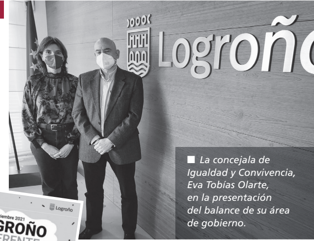
La concejala de Igualdad y Convivencia, Eva Tobías Olarte, en la presentación del balance de su área de gobierno.