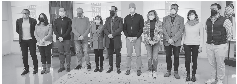
■ El alcalde, concejales, representantes de unidades municipales y agentes culturales, en el balance.

E l alcalde de Logroño, Pablo Hermoso de Mendoza, junto con varios concejales del Equipo de Gobierno, representantes de las unidades municipales y diferentes agentes culturales, ha realizado un balance del programa conmemorativo del V Centenario del Sitio. Además, ha anunciado que Logroño se prepara ya para conmemorar en 2022 los 500 años del Voto de San Bernabé y que se mantendrá el lema de la efeméride anterior, 'Una historia que nos une'.