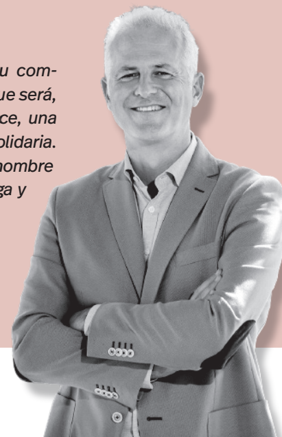
Pablo Hermoso de Mendoza / Alcalde de Logroño

del Ayuntamiento, volvieron a demostrar su compromiso con la ciudad, en un anticipo de lo que será, en mayo del año que viene, la Gladiator Race, una prueba deportiva de obstáculos popular y solidaria. Agradezco como alcalde de la ciudad, en nombre de todo el consistorio, su dedicación, entrega y compromiso con Logroño.