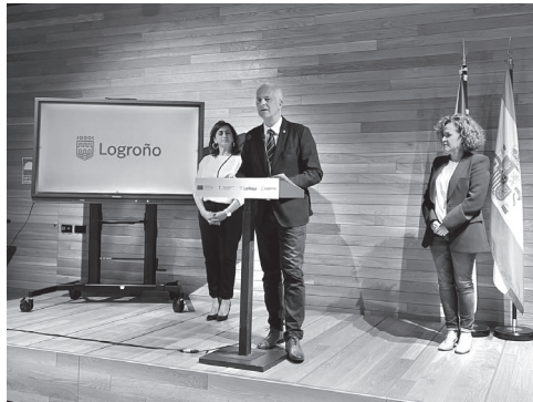
■ Presentación del Plan 'Logroño Enópolis'.

El Espacio Lagares acogió la presentación de las actuaciones turísticas integradas en el Plan de Sostenibilidad 'Logroño Enópolis. Capital de la Enorregión', uno de los tres planes locales que integran la primera fase del despliegue turístico de la Enorregión y que inciden en los municipios riojanos con proyectos enoturísticos. La propuesta de Logroño ha obtenido 3 040 000 euros de fondos europeos Next Generation, a través del Plan de Recuperación, Transformación y Resiliencia.