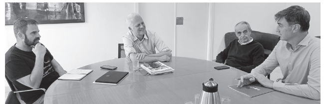
■ Reunión con la Asociación de Personas Sordas de La Rioja y con los responsables de Down La Rioja Arsido.