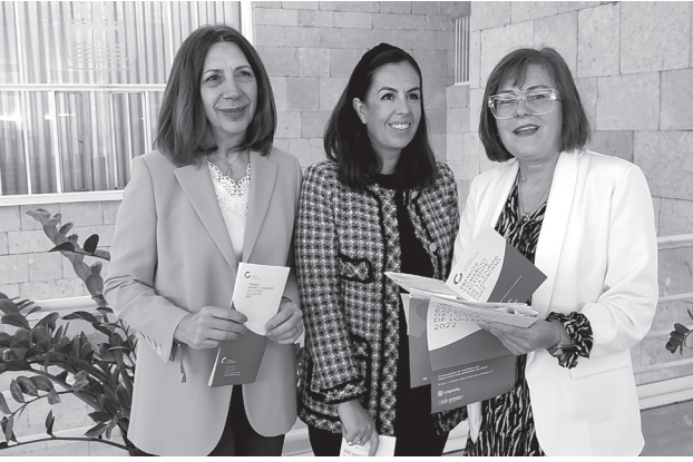
■ La concejala de Comercio, la vicerrectora de la Universidad de La Rioja y la directora de la Cátedra, en la presentación de la convocatoria.

Ya está en marcha una nueva convocatoria de los 'Premios Comercio Excelente de la Ciudad de Logroño 2022', que reconocen las buenas prácticas y la excelencia del comercio local logroñés en su contribución al desarrollo de la capital riojana. Las candidaturas pueden presentarse hasta el día 9 de noviembre.