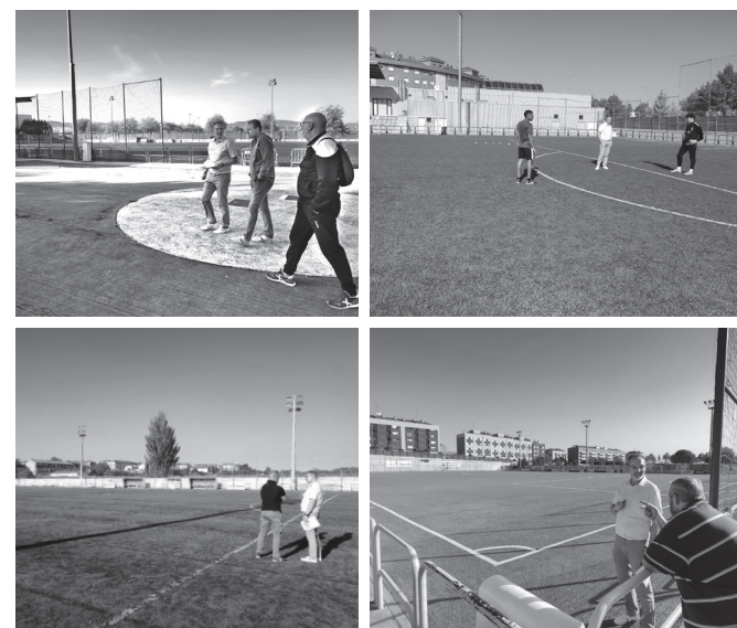
El concejal de Deportes visitó los campos de La Estrella, La Ribera, Varea, Yagüe y Pradoviejo.

Durante la visita, el concejal estuvo acompañado por los responsables de los distintos equipos. El recorrido comenzó en La Estrella y siguió por Varea, Yagüe, La Ribera y Pradoviejo.