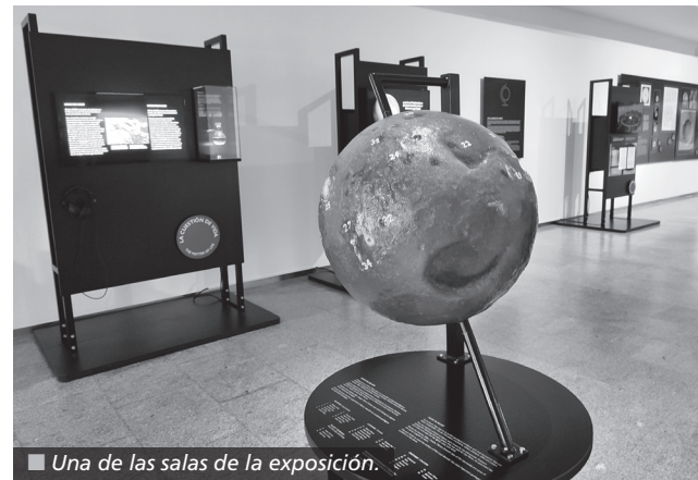
■ Una de las salas de la exposición.