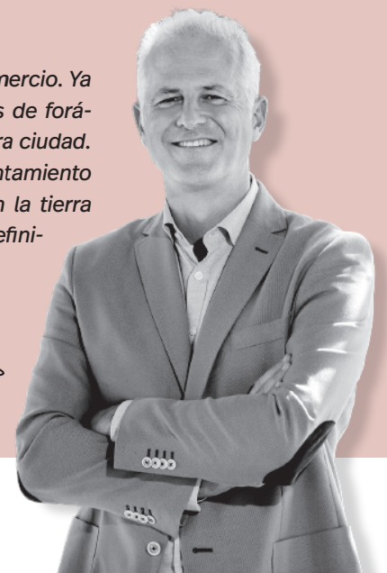
Pablo Hermoso de Mendoza / Alcalde de Logroño

nuestras bodegas y la variedad de nuestro comercio. Ya no es extraño encontrarse con varios grupos de foráneos en el centro histórico conociendo nuestra ciudad. Un turismo sostenible, genuino, donde el Ayuntamiento estimula la generación de oportunidades. En la tierra donde nadie debería sentirse extranjero. En definitiva, un hogar auténtico.