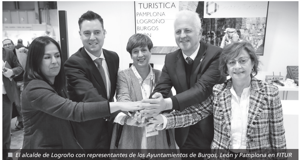
El alcalde de Logroño con representantes de los Ayuntamientos de Burgos, León y Pamplona en FITUR

La presencia de Logroño en FITUR 2023 sirve para promocionar la ciudad y la cultura del vino que atesora, por lo que la feria también es escenario de diferentes reuniones de trabajo junto con los agentes económicos y turísticos de otras ciudades y comunidades autónomas, así como con entidades como la Asociación Española de Ciudades del Vino (ACEVIN) o medios de comunicación especializados en este sector, entre otros.