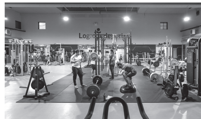
■ Sala de musculación de Las Gaunas.

pecializado de Logroño Deporte que orienta sobre el tipo de ejercicio que puede resultar más beneficioso según el perfil de la persona interesada en mantenerse en forma con la empresa municipal.