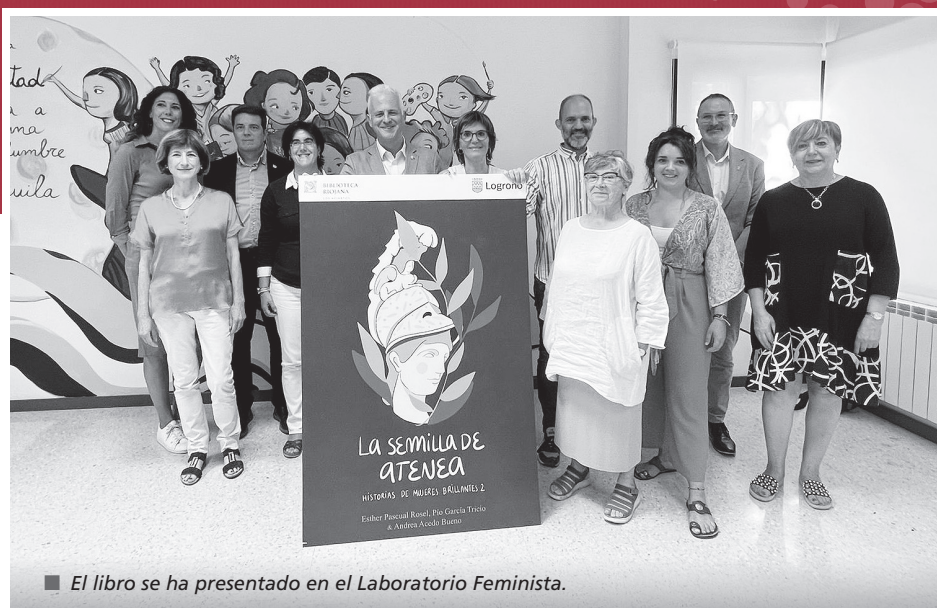
El libro se ha presentado en el Laboratorio Feminista.