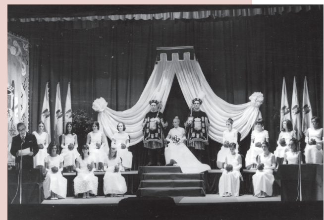
■ Juegos Florales del XV Certamen de Exaltación de Valores Riojano, 1969, Foto Teo.

Los Vendimiadores como hoy los conocemos aparecen en 1991. Es entonces cuando se produce la transformación total. Se