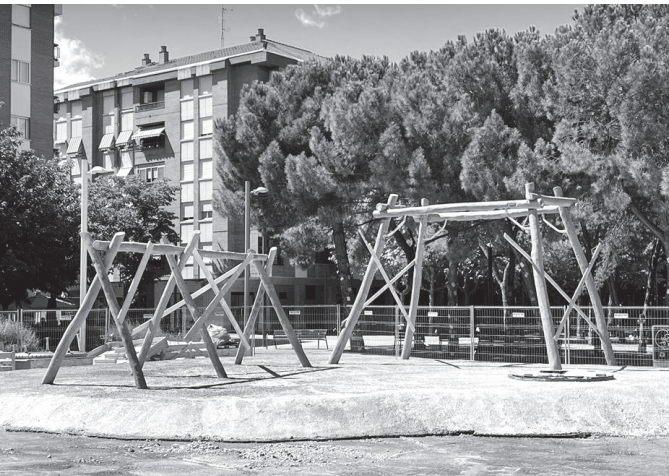
■ El montaje concluirá este mes de septiembre.

Ya han comenzado los trabajos de montaje de los juegos de la plaza Primero de Mayo, para su posterior sustitución por nuevos elementos.