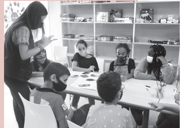
■ Ya se puede solicitar plaza en cada una de las nueve ludotecas municipales.

El periodo de inscripción ya se ha iniciado. Del 8 al 30 de septiembre está reservado a familias prioritarias. Del 3 al 21 de octubre se abre el plazo para cualquier familia con niñas y niños empadronados en Logroño nacidos entre los años 2012 y 2018. Y a partir del 24 de octubre se podrá solicitar ludoteca, si quedan vacantes, sin necesidad de estar empadronados en Logroño.