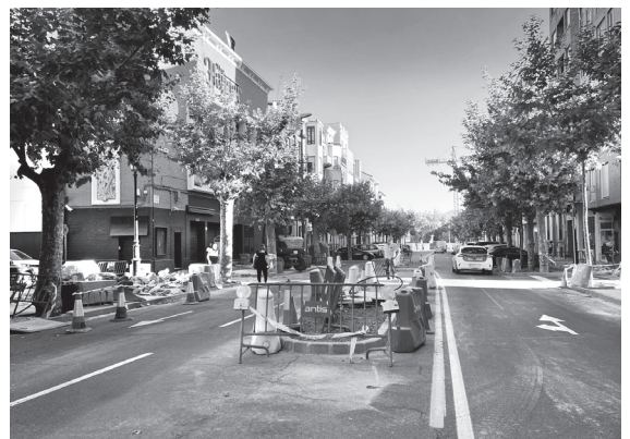
■ Paso peatonal en la avenida de Navarra.