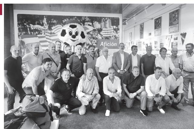
■ Presentación de la exposición.

El local ha sido acondicionado y todos los objetos limpiados, restaurados y clasificados por personal de Logroño Deporte; una tarea que ha sido valorada y muy agradecida por el concejal. Posteriormente Logroño Deporte suscribió un acuerdo de colaboración con Fundación Caja Rioja para el comisariado y