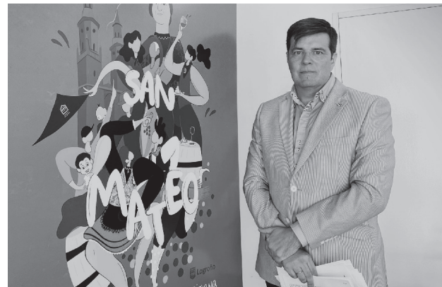
■ La presentación del cartel tuvo lugar el 5 de septiembre.

i Toda la programación puede consultarse en la web del Ayuntamiento: logroño.es .