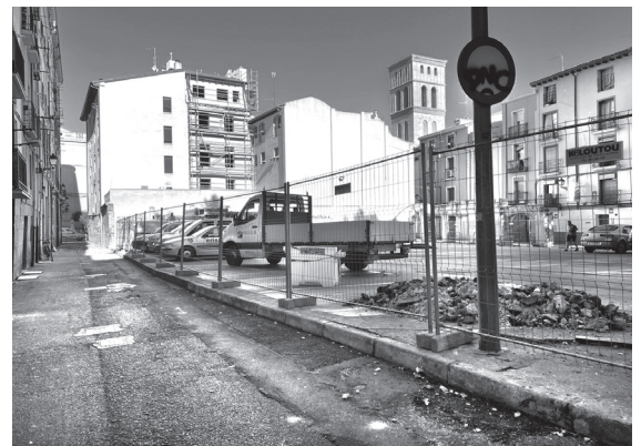
■ La calle Hospital Viejo, ya en obras.

En estos momentos se está llevando a cabo, además, el paso peatonal en avenida Navarra, en la prolongación de la calle Obispo Bustamante, que dotará de seguridad los itinerarios peatonales; así como el centro de salud.