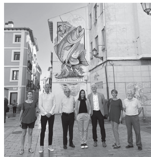
■ Autoridades, impulsor del proyecto, autora y miembros de la Cofradía del Pez.

El público participante estará acompañado en todo momento por un guía que explicará la historia de cada mural y sus autores, así como introducir cada espectáculo de luz y sonido. Las rutas tendrán lugar, a las 21:00 horas, del 8 al 15 septiembre; del 26 al 30 de septiembre; y del 1 al 7 de octubre.